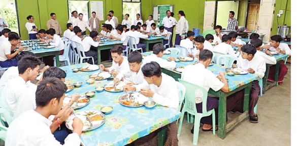
လယ်ယာကဏ္ဍပွံ့ပြိုးရေးအတွက် အလယ်အလတ်အဆင့် စိုက်ပျိုးရေးပညာကျွမ်းကျင်သူ လူ့အရင်းအမြစ်များ တိုးမြှင့်ပေးနိုင်ရေးကြိုးပမ်း