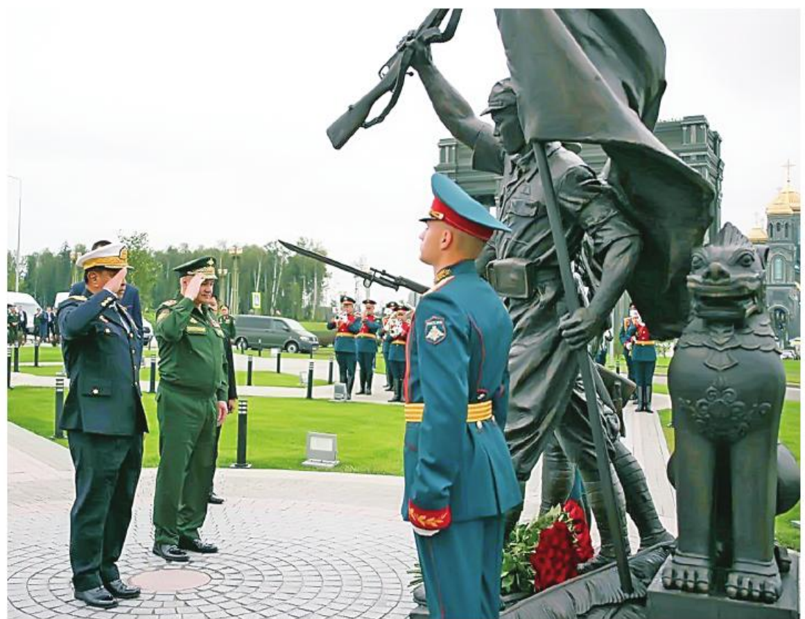
ရုရှားဖက်ဒရေးရှင်းနိုင်ငံ ကာကွယ်ရေးဝန်ကြီး Army General Sergey Kuzhugotovovich Shoigu နှင့် နိုင်ငံတော်စီမံအုပ်ချုပ်ရေးကောင်စီအဖွဲ့ဝင် ဒုတိယဝန်ကြီးချုပ်နှင့် ကာကွယ်ရေးဝန်ကြီးဌာန ပြည်ထောင်စုဝန်ကြီး ဝိုလ်ချုပ်ကြီးတင်အောင်စန်းတို့ ဒုတိယကမ္ဘာစစ်ကာလအတွင်း တိုက်ပွဲဝင်ခဲ့ကြသည့် “မြန်မာ့စစ်သည်တော်မဟာမိတ်များ” အမည်ရှိ အထိမ်းအမှတ်ရုပ်တုပွင့်ပွဲ ဂုဏ်ပြုပန်းစည်းများချ၍ အလေးပြုကြစဉ်။

နေပြည်တော် ၊ ဩဂုတ် ၂၀ ရုရှားဖက်ဒရေးရှင်းနိုင်ငံ ရုရှားတပ်မတော် ပင်မဘုရားရှိခိုးကျောင်းတော်ကြီး Main Cathedral of the Armed Forces တည်ရှိရာ မော်စကိုခရိုင် ကူဘင်ကာမြို့ မျိုးချစ်ပန်းခြံ Patriot Park အတွင်း၌ ဒုတိယကမ္ဘာစစ်ကာလအတွင်း တိုက်ပွဲဝင်ခဲ့ကြသည့် “မြန်မာ့စစ်သည်တော် မဟာမိတ်များ” အမည်ရှိ အထိမ်းအမှတ်ရုပ်တုပွင့်ပွဲကို ဩဂုတ် ၁၄ ရက်တွင်ကျင်းပပြုလုပ်သည်။ အဆိုပါအခမ်းအနားသို့ ရုရှားဖက်ဒရေးရှင်းနိုင်ငံ ကာကွယ်ရေးဝန်ကြီး Army General Sergey Kuzhugotovovich Shoigu နှင့်ကာကွယ်ရေးဝန်ကြီးဌာနမှ တာဝန်ရှိသူများ၊ ပြည်ထောင်စုသမ္မတမြန်မာနိုင်ငံတော် နိုင်ငံတော်စီမံအုပ်ချုပ်ရေးကောင်စီအဖွဲ့ဝင် ဒုတိယဝန်ကြီးချုပ်နှင့် ကာကွယ်ရေးဝန်ကြီးဌာန ပြည်ထောင်စုဝန်ကြီး ဝိုလ်ချုပ်ကြီး တင်အောင်စန်းနှင့် တာဝန်ရှိသူများ၊ မြန်မာစစ်သံ (ကြည်း၊ ရေ၊ လေ) ဝိုလ်မှူးချုပ်မိုးကျော်နှင့် အဖွဲ့ဝင်များ၊ ဒေသခံပြည်သူများ တက်ရောက်ကြသည်။ စာမျက်နှာ ၁၆ ကော်လံ ၁ မှ