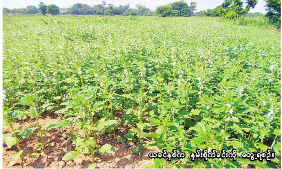
ယခင်နှစ်က မိုးစိုက်ခင်းကို တွေ့ရစဉ်။