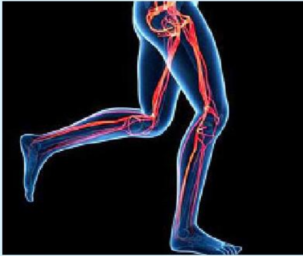
မိမိတို့ရဲ့ ခန္ဓာကိုယ်မှာ ပေါ်လွင်လာပြီး သန်မာလာမှာ အဆီပိုတွေ မရှိတော့ဘူးဆိုရင် ကြွက်သားတွေကလည်း ပိုမို ဖြစ်ပေါ်တယ်။

တော့ တစ်ရက်ကို ခြေလှမ်းရေ ထိရောက်မှုရှိလှပါတယ်။ ၁၀၀၀၀ လောက် လမ်းလျှောက် ပေးရုံနဲ့တင် ရရှိနိုင်ပါတယ်။ ဒီထက်ပိုပြီး ပြင်းထန်တဲ့ လေ့ကျင့်ခန်းမျိုးလိုချင်တယ်ဆို ရင်တော့ တောင်တက်လမ်း လျှောက်ခြင်းကိုလည်း ကြိုးစား ကြည့်သင့်ပါတယ်။ ဒါ့အပြင် စတုရန်း ၃၀ မှ ၁ မီနစ် ၂ မိနစ်အထိ ခပ်မြန်မြန်လမ်း လျှောက်ပြီး ပုံမှန်လမ်းပြန် လျှောက်ခြင်း၊ အဲဒီနောက် ခပ် မြန်မြန်ပြန်ပြီး လမ်းလျှောက်ခြင်း လိုမျိုး လေ့ကျင့်ခန်းတွေကလည်း စေပါဘူး။ လမ်းလျှောက်ခြင်းဟာ သင့် ခန္ဓာကိုယ်တစ်လျှောက်မှာရှိတဲ့ ကြွက်သားတွေရဲ့ တင်းအားကို တိုးမြှင့်စေတာသာဖြစ်ပါတယ်။ လမ်းလျှောက်ခြင်းဟာ ပြင်း ထန်တဲ့ လေ့ကျင့်ခန်းမဟုတ်တဲ့ အတွက် ကြွက်သားတွေနာကျင် ခြင်းမရှိစေပါဘူး။ ဒါကြောင့် အနာတရဖြစ်တာမျိုး၊ နောက် တစ်ခေါက် လမ်းလျှောက်ဖို့ အတွက် ကြွက်သားတွေနာလို့ မလျှောက်နိုင်တာမျိုးလည်း မဖြစ် စေပါဘူး။