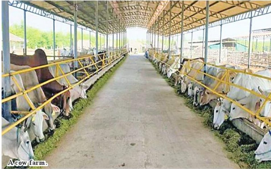
A cow farm.