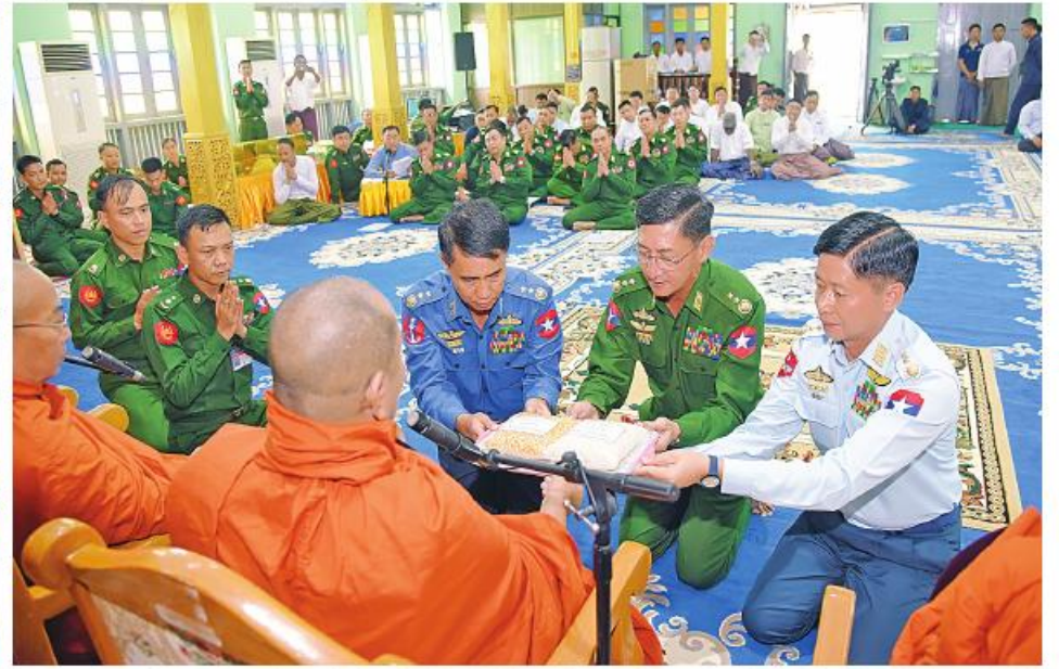
တပ်မတော်(ကြည်း၊ရေ၊လေ)မိသားစုများနှင့် စေတနာရှင်ပြည်သူများက ဆွမ်းဆန်တော်၊ ဆီ၊ ဆား၊ ပဲ၊ ဆေးနှင့် ဆွမ်းပဒေသာပင်အလှူငွေများ လှူဒါန်းပွဲအခမ်းအနားကျင်းပစဉ်။