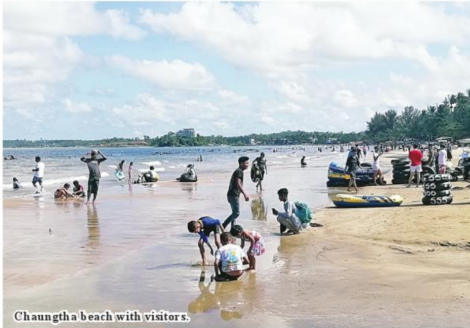
Chaungtha beach with visitors.

Number of travellers increases to more than 600 on weekends. Most of travellers to the two beaches came from Yangon Region.