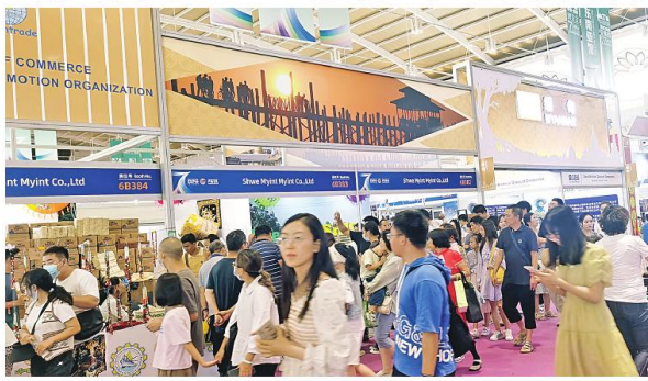
တရုတ်-တောင်အာရှကုန်စည်ပြပွဲနှင့် (၂၇)ကြိမ်မြောက် တရုတ်(ကုမ္ပဏီ)ပိုက်ဆံသွင်းကုန် ကုန်စည်ပြပွဲနှစ်ခုကို လက်မှတ်ရေးထိုး

တရုတ်နိုင်ငံ ယူနန်ပြည်နယ် ကွမ်မင်းမြို့ရှိ Dianchi International Convention and Exhibition Center တွင် ကွမ်မင်းမြို့လုပ်နေသည့် (၇)ကြိမ်မြောက် တရုတ်-တောင်အာရှ ကုန်စည်ပြပွဲနှင့် (၂၇)ကြိမ်မြောက် တရုတ်(ကုမ္ပဏီ) ပိုက်ဆံသွင်းကုန် ကုန်စည်ပြပွဲနှစ်ခုကို လက်မှတ်ရေးထိုးခဲ့ကြောင်း သိရသည်။