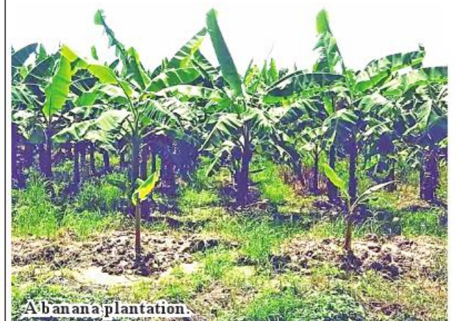
A banana plantation.