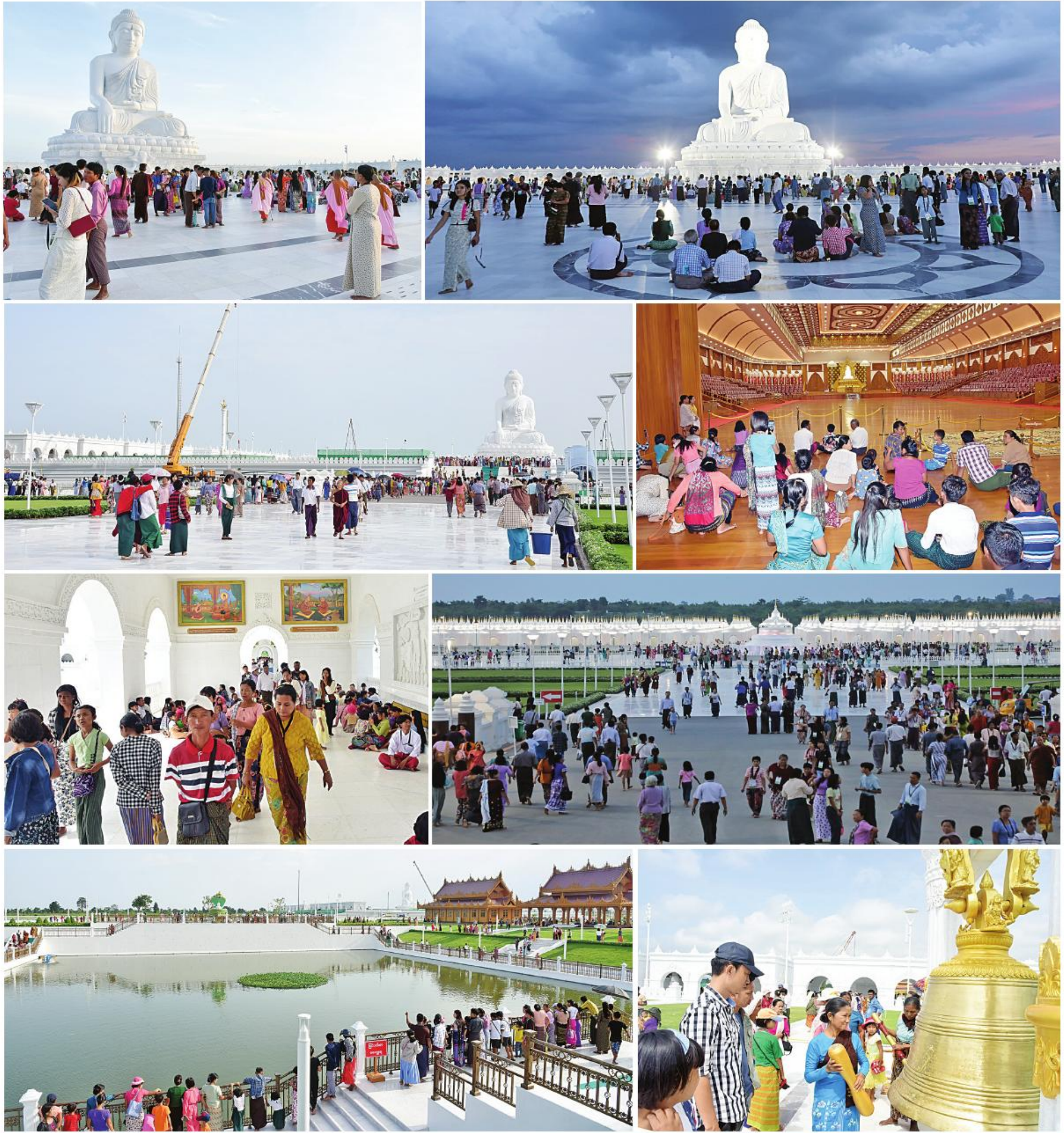
ကမ္ဘာပေါ်ရှိထိုင်တော်မူ ကျောက်ဆစ်ဗုဒ္ဓရုပ်ပွားတော်များအနက် ဉာဏ်တော်အမြင့်ဆုံးဖြစ်သည့် မာရဝိဇယဗုဒ္ဓရုပ်ပွားတော်မြတ်ကြီးအား အနယ်နယ်အရပ်ရပ်မှ လာရောက်ဖူးမြော်ကြည်ညိုကြသည့် ရဟန်းရှင်လူ ဘုရားဖူးပြည်သူများဖြင့် အထူးစည်ကားလျက်ရှိမှုကို တွေ့မြင်ရစဉ်။