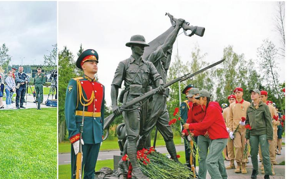
ရုရှားတပ်မတော်မှ ဗိုလ်ချုပ်မှူးကြီး Army General Sergey Kuznetsov က အဖွင့်အမှာစကားပြောနေပုံ