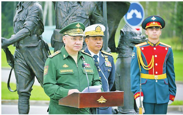
ရုရှားတပ်မတော်မှ ဗိုလ်ချုပ်မှူးကြီး Army General Sergey Kuznetsov က အဖွင့်အမှာစကားပြောနေပုံ