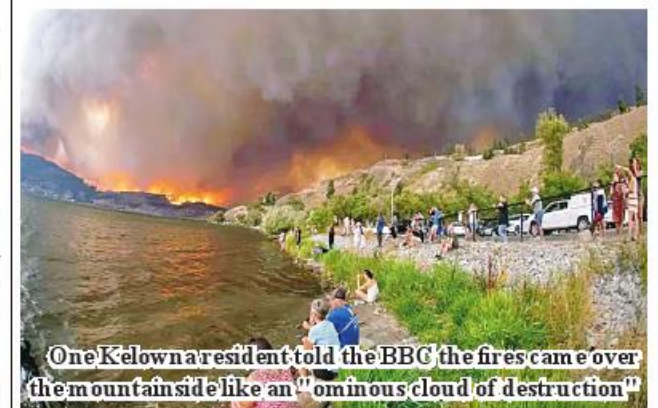
One Kelowna resident told the BBC the fires came over the mountainside like an "ominous cloud of destruction"