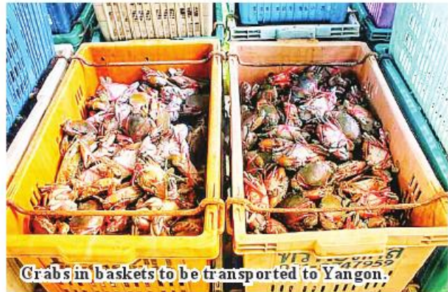
Crabs in baskets to be transported to Yangon.