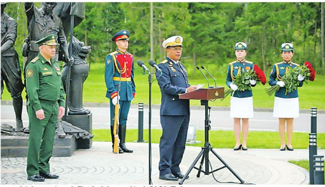
ရုရှားတပ်မတော်မှ ဗိုလ်ချုပ်မှူးကြီး Army General Sergey Kuznetsov က အဖွင့်အမှာစကားပြောနေပုံ

ပြည်ထောင်စုသမ္မတမြန်မာနိုင်ငံတော် အစိုးရအဖွဲ့ဝန်ကြီး ဦးစိန်ဝင်းက ဝန်ထမ်းများအား အားပေးစကားပြောနေပုံ