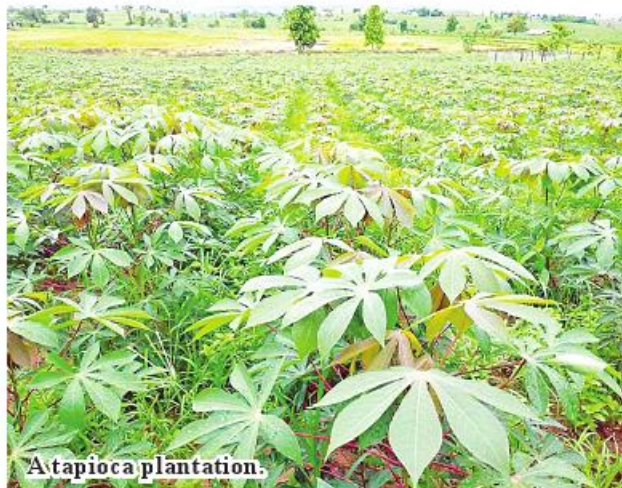
A tapioca plantation.