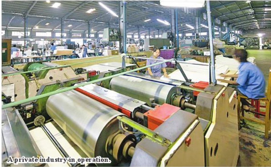
A private industry in operation.