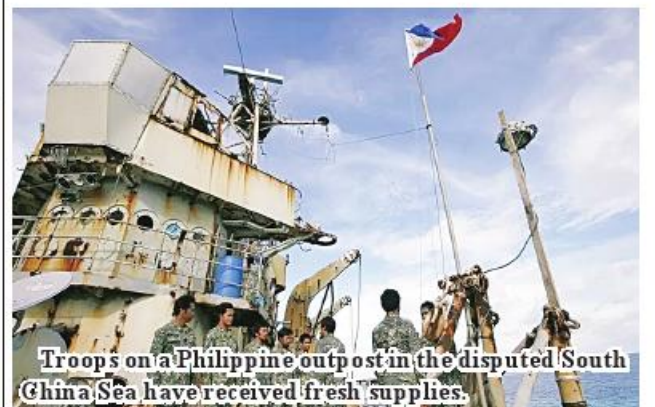
Troops on a Philippine outpost in the disputed South China Sea have received fresh supplies.