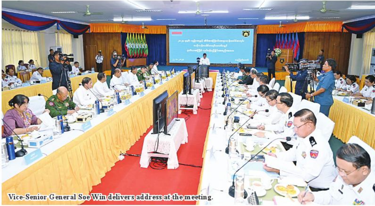
Vice-Senior General Soe Win delivers address at the meeting.