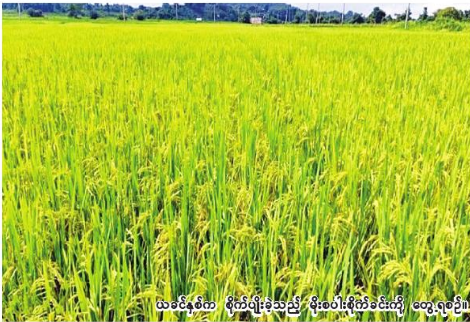
ယခင်နှစ်က စိုက်ပျိုးခဲ့သည့် မိုးစပါးစိုက်ခင်းကို တွေ့ရစဉ်။