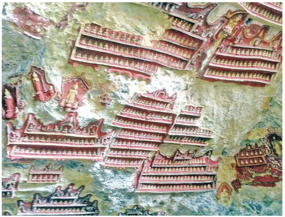
ကော့ဂွန်းဂူအတွင်းနံရံပေါ်မှ ဗုဒ္ဓဆင်းတုရုပ်ပွားငယ်များကို တွေ့ရစဉ်။

ကော့ဂွန်းဂူရှိ ကျောက်ရုပ်ကြွသုံးခုအနက် နှစ်ခုမှာ ဗုဒ္ဓဘာသာဆိုင်ရာရုပ်တုများဖြစ်ပြီး ကျန်တစ်ခုမှာ ဟိန္ဒူအယူဝါဒဆိုင်ရာရုပ်တုဖြစ်ကြောင်း မြန်မာ့စွယ်စုံကျမ်းနှစ်ချုပ်(၂၀၁၁)တွင် ဖော်ပြထားသည်။