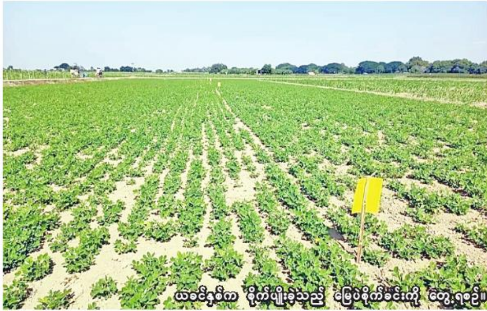
ယခင်နှစ်က စိုက်ပျိုးခဲ့သည့် မြေပိုစိုက်ခင်းကို တွေ့ရစဉ်။