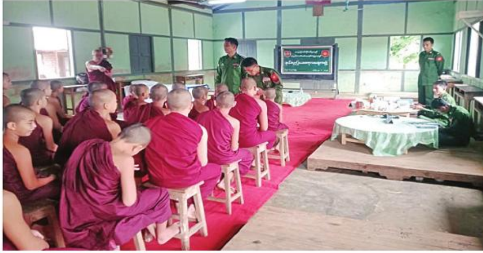
သံဃာတော်များအား အရှေ့မြောက်တိုင်း ဝန်ကြီးရုံးမှ နယ်မြေခံနယ်လှည့် ဆေးကုသရေး အဖွဲ့က ကျန်းမာရေး စောင့်ရှောက်မှု လုပ်ငန်းများ ဆောင်ရွက်ပေးစဉ်။

နေပြည်တော်၊ ဩဂုတ် ၂၂ ရှမ်းပြည်နယ်(မြောက်ပိုင်း) ကျောက်မဲမြို့နယ် ပကာကျေးရွာရှိ သံဃာတော်များနှင့် ဒေသခံပြည်သူများကို အရှေ့မြောက်တိုင်းစစ်ဌာနချုပ် နယ်မြေခံနယ်လှည့် ဆေးကုသရေးအဖွဲ့က ယနေ့ နံနက်ပိုင်းတွင် အဆိုပါကျေးရွာရှိ ဇောတိကာရုံကျောင်းတိုက်၌ ကျန်းမာရေးစောင့်ရှောက်မှု လုပ်ငန်းများ ဆောင်ရွက်ပေးသည်။ ထိုသို့ ဆောင်ရွက်ပေးရာတွင် သံဃာတော် ၄၆ ပါးနှင့် ဒေသခံပြည်သူ ၂၇ ဦးတို့ကို မျက်စိရောဂါ၊ သွားနှင့်ခံတွင်းရောဂါ၊ ခွဲစိတ်ကုသမှုဆိုင်ရာရောဂါ၊ နား၊ နှာခေါင်း၊ လည်ချောင်းရောဂါ၊ ဖျားနာရောဂါ၊ အထွေထွေရောဂါတို့နှင့် ပတ်သက်၍ လိုအပ်သည့် ကျန်းမာရေးစောင့်ရှောက်မှု လုပ်ငန်းများ ဆောင်ရွက်ပေးပြီး ECG စက်၊ Ultrasound စက်တို့ဖြင့် ရောဂါရှာဖွေ စမ်းသပ်စစ်ဆေးပေးခြင်းများကို ဆောင်ရွက်ပေးသည်။ ယင်းသို့ ဆောင်ရွက်ပေးနေမှုများကို တိုင်းစစ်ဌာနချုပ်မှ တာဝန်ရှိသူများက သွားရောက်ကြည့်ရှု အားပေးခဲ့ကြကြောင်း သတင်းရရှိသည်။