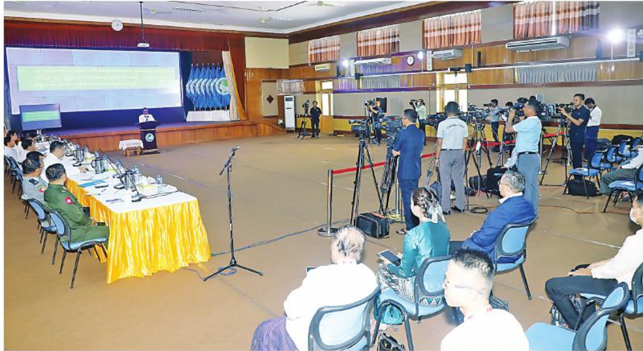
နိုင်ငံတော်စီမံအုပ်ချုပ်ရေးကောင်စီ သတင်းထုတ်ပြန်ရေးအဖွဲ့က သတင်းမီဒီယာများနှင့်တွေ့ဆုံ၍ (၂၂)ကြိမ်မြောက် သတင်းစာ ရှင်းလင်းပွဲပြုလုပ်စဉ်။

နေပြည်တော် ဩဂုတ် ၂၂ ရေးကောင်စီ သတင်းထုတ်ပြန်ရေးအဖွဲ့ ကြားသည်။ နိုင်ငံတော် စီမံအုပ်ချုပ်ရေးကောင်စီ ခေါင်းဆောင် ဗိုလ်ချုပ်လော်မင်းထွန်း၊ ဌာန ဦးစွာ နိုင်ငံတော်စီမံအုပ်ချုပ်ရေးကောင်စီ သတင်းထုတ်ပြန်ရေးအဖွဲ့၏ (၂၂)ကြိမ် မြောက် သတင်းစာရှင်းလင်းပွဲကို ယနေ့ ဆိုင်ရာများမှ ပြောရေးဆိုခွင့်ရှိသူများနှင့် သတင်းထုတ်ပြန်ရေးအဖွဲ့ ခေါင်းဆောင် မြောက် သတင်းစာရှင်းလင်းပွဲကို ယနေ့ ဌာနဆိုင်ရာ သတင်းထုတ်ပြန်ရေးအဖွဲ့ ဗိုလ်ချုပ်လော်မင်းထွန်းက နိုင်ငံတော်စီမံ မွန်းလွဲပိုင်းတွင် ပြန်ကြားရေးဝန်ကြီးဌာန၌ ကိုယ်စားလှယ်များက သတင်းမီဒီယာများ၏ အုပ်ချုပ်ရေးကောင်စီနှင့်ပြည်ထောင်စုအစိုးရ သိရှိလိုသည့်မေးမြန်းမှုများကို ပြန်လည်ဖြေ အဖွဲ့ စာမျက်နှာ ၁၉ ကော်လံ ၄ ☆