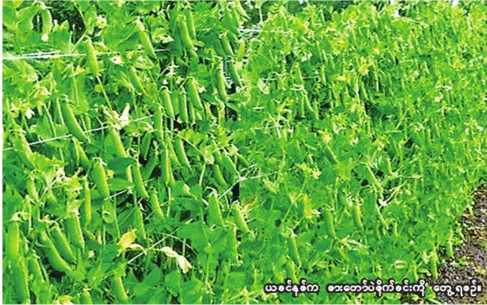
ယခင်နှစ်က အင်းတော်ပဲစိုက်စခန်းကို တွေ့ရစဉ်။

အင်းတော် ဩဂုတ် ၂၂ စစ်ကိုင်းတိုင်းဒေသကြီး ကသာခရိုင် အင်းတော်မြို့နယ်တွင် ယခုနှစ် ဆောင်းသီးနှံစိုက်ပျိုးရာသီ၌ ပဲမျိုးစုံ ၇၀၆၁ ဧက စိုက်ပျိုးမည် ဖြစ်ကြောင်း အင်းတော်မြို့နယ် စိုက်ပျိုးရေးဦးစီးဌာနမှ သိရသည်။