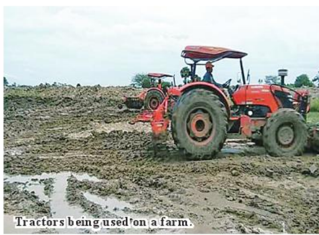
Tractors being used on a farm.