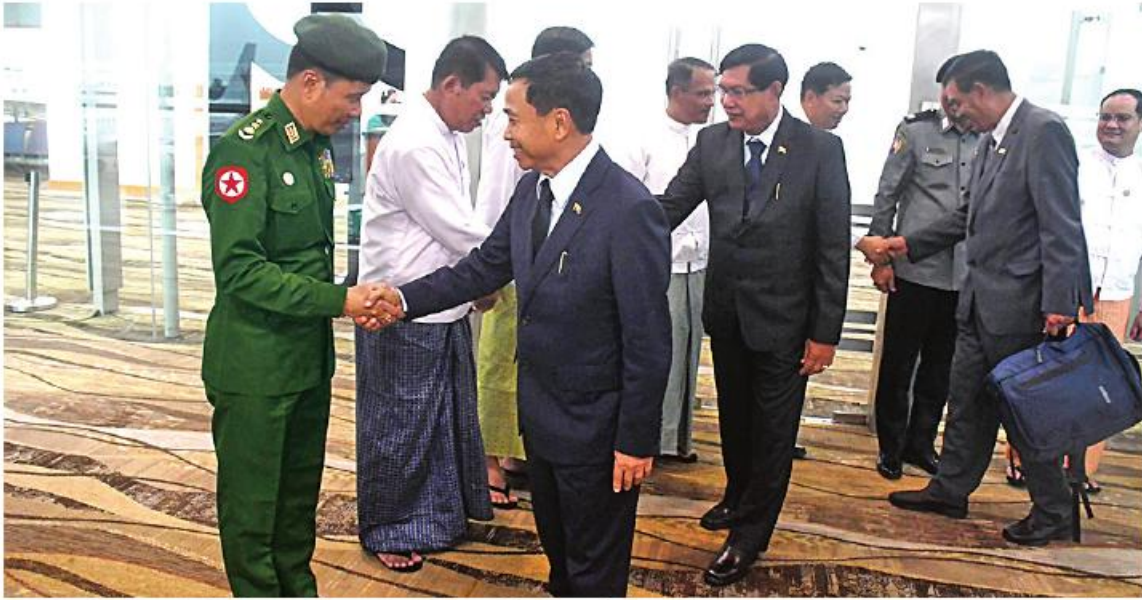
ရန်ကုန် ဩဂုတ် ၂၂ ရုရှားဖက်ဒရေးရှင်းနိုင်ငံ မော်စကိုမြို့သို့ ထွက်ခွာသည့် နိုင်ငံတကာသယ်ယူပို့ဆောင်ရေးထိပ်သီးအစည်းအဝေး (International Transport Summit 2023)သို့ တက်ရောက်ရန် နေပြည်တော်ကောင်စီဥက္ကဋ္ဌ ဦးဆောင်သောကိုယ်စားလှယ်အဖွဲ့သည် ယနေ့ ညပိုင်းက ရန်ကုန်မြို့မှ ရုရှားဖက်ဒရေးရှင်းနိုင်ငံ မော်စကိုမြို့သို့

လေကြောင်းခရီးဖြင့် ထွက်ခွာသွားသည်။ နေပြည်တော်ကောင်စီဥက္ကဋ္ဌ ဦးသန်းထွန်းဦးနှင့်အဖွဲ့ကို ရန်ကုန်တိုင်းဒေသကြီး ဝန်ကြီးများရန်ကုန်တိုင်းဒေသကြီး ပုဂ္ဂလိကသယ်ယူပို့ဆောင်ရေးကြီးကြပ်မှု ကော်မတီအဖွဲ့မှ တာဝန်ရှိသူများက ရန်ကုန်အပြည်ပြည်ဆိုင်ရာလေဆိပ်၌ ပို့ဆောင်ခွတ်ဆက်ကြသည်။ နိုင်ငံတကာ သယ်ယူပို့ဆောင်ရေးထိပ်သီးအစည်းအဝေးသို့ တက်ရောက်ရန် နေပြည်တော်ကောင်စီဥက္ကဋ္ဌ ခေါင်းဆောင်၍ အဖွဲ့ဝင်များအဖြစ် ရန်ကုန်တိုင်းဒေသကြီး ဝန်ကြီးချုပ် ဦးစိုးသိန်း၊ ဒေါက်တာသက်ခိုင်ထွန်း (အင်ဂျင်နီယာ) ဒုတိယဥက္ကဋ္ဌကြားရေးမှူး နေပြည်တော်စည်ပင်သာယာရေးကော်မတီ ဦးချစ်ကိုကို ဒုတိယဥက္ကဋ္ဌ ရန်ကုန်တိုင်းဒေသကြီးပုဂ္ဂလိကသယ်ယူပို့ဆောင်ရေး ကြီးကြပ်မှုကော်မတီ