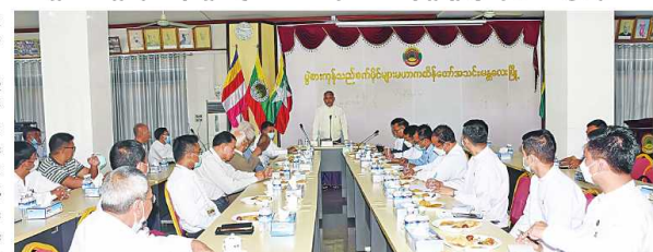
ပြည်ထောင်စုဝန်ကြီး ဦးအောင်နိုင်ဦး ပွဲစားကုန်သည်စက်ဝိုင်းများမဟာကထိန်တော်အသင်း(မန္တလေးကုန်စည်ဒိုင်)နှင့် တာဝန်ရှိသူများနှင့် တွေ့ဆုံအားပေးပြောကြားစဉ်

ပြည်ထောင်စုဝန်ကြီး ဦးအောင်နိုင်ဦး ပွဲစားကုန်သည်စက်ဝိုင်းများ မဟာကထိန်တော်အသင်း(မန္တလေးကုန်စည်ဒိုင်)နှင့် မန္တလေးတိုင်းဒေသကြီး ကုန်သည်များနှင့် စက်မှုကုန်ထုတ်လုပ်ရေးအသင်းမှ တာဝန်ရှိသူများနှင့် တွေ့ဆုံ