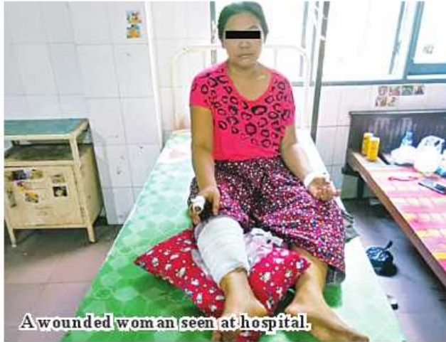
A wounded woman seen at hospital.