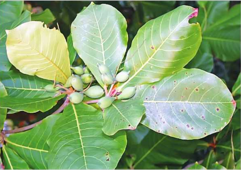
ဆေးဖက်ဝင် ဗာဒံရွက်ကို တွေ့ရစဉ်။

ဖြေ ။ ။ လက်မောင်းကပ်ရောဂါဟာ ခိုက်မိဒဏ်တစ်ခုခုကြောင့် နာကျင်လို့ လက်ကိုမလှုပ်ဘဲ ငြိမ်ငြိမ်ထားရာကနေ ကြာတဲ့အခါ တဖြည်းဖြည်း အကြောတွေဆိုးပြီး ကပ်သွားတတ်ပါတယ်။ လက်မောင်းကပ်ရင် လေ့ကျင့်ခန်းပြုလုပ်ပါ။ လက်ကိုမြှောက်တာ၊ ကွေးတာ၊ ဆန့်တာ အကြိမ် ၂၀ လောက်ပြုလုပ်ပေးပါ။ တစ်နေ့ သုံးကြိမ်ပြုလုပ်ပါ။ တတ်နိုင်သမျှ အနာခံပြီးပြုလုပ်ပါ။ လက်မောင်းကပ်ရောဂါဟာ သန်တဲ့ဘက်ကဖြစ်ရင် ပိုပြီးပျောက်လွယ်ပါတယ်။ ဥပမာ-ညာသန်ဖြစ်ရင် ညာဘက်လက်က အသုံးများလို့ပျောက်လွယ်တယ်။ မသန်တဲ့ ဘယ်လက်မှာဖြစ်ရင် အသုံးနည်းလို့ ပျောက်ခဲတယ်။ လေ့ကျင့်ခန်းမှန်မှန်လုပ်ရင် ၁၄ ရက်အတွင်း ပျောက်ကင်းနိုင်ပါတယ်။ ကြပ်ထုပ်ထိုးကုသတာကလဲ အထောက်အကူဖြစ်ပါတယ်။ ဆားကြပ်ထုပ် ထိုးနိုင်ပါတယ်။ မိသလင်ကြပ်ထုပ်ကတော့ အကောင်းဆုံးပါ။ မုန်ညင်းဆီလိမ်းပြီး ရေခဲခဲကာထိုးပေးပါ။ ချင်းခြောက် အမှုန့် သုံးဆ၊ လင်းနေအမှုန့် တစ်ဆ၊ သစ်ကြဲပိုးအခေါက်မှုန့်တစ်ဆ ရောပြီး ရေခဲခဲနဲ့ဖျော် လက်မောင်းဆုံမှာ အုံပြီး စည်းပေးရင် လက်မောင်းကပ်ရောဂါ ပျောက်ကင်းနိုင်ပါတယ်။