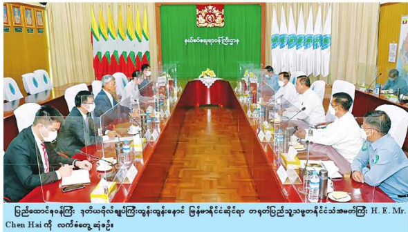
ပြည်ထောင်စုဝန်ကြီး ဒုတိယဗိုလ်ချုပ်ကြီးထွန်းထွန်းနောင် ပြန်ပေါ်နိုင်ငံသို့ရောက်ရှိပြီး H. E. Mr. Chen Hai ကို လက်ခံတွေ့ဆုံခဲ့ပြီးနောက်

ပြည်ထောင်စုဝန်ကြီး ဒုတိယဗိုလ်ချုပ်ကြီးထွန်းထွန်းနောင် ပြန်ပေါ်နိုင်ငံသို့ရောက်ရှိပြီးနောက် ဖရူဆိုင်းဇာတိတို့က ညွှန်ကြားရေးမှူးချုပ်အဖြစ် ရက်စက်စွာ ဆောင်ရွက်နိုင်ခဲ့ကြောင်း တွေ့ရှိရပါသည်။