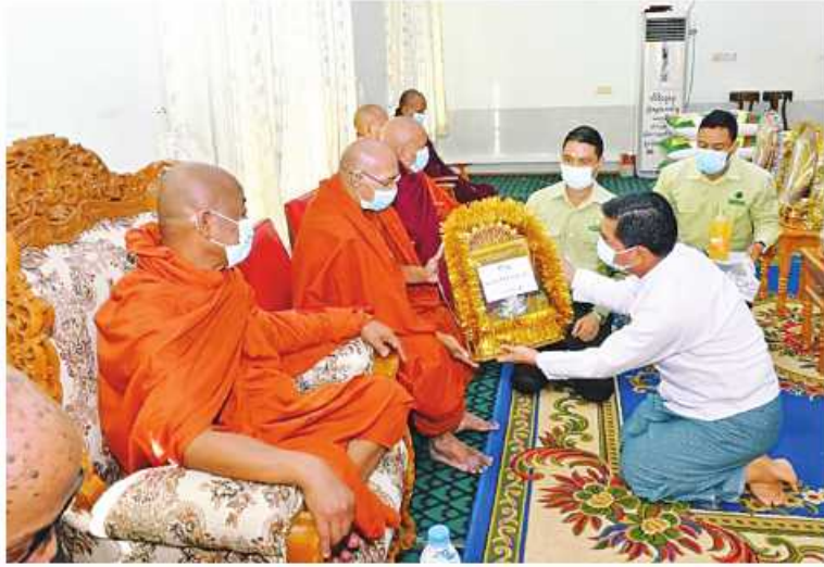
ဆရာတော်၊ သံဃာတော်များကို တာဝန်ရှိသူတစ်ဦးက သက်န်း၊ လှူဖွယ်ပစ္စည်းများနှင့် နဝကမ္မဝတ္ထုငွေများ ဆက်ကပ်လှူဒါန်းစဉ်။

နေပြည်တော် အောက်တိုဘာ ၂၁ - မကွေးတိုင်းဒေသကြီး မကွေးမြို့ရှိ မဟာဝိသုတာရာမ(တိုက်သစ်)၌ ထေရ်ကြီး ဝါကြီးဆရာတော်ကြီးများကို သက်န်း၊ လှူဖွယ် ပစ္စည်းများနှင့် နဝကမ္မဝတ္ထုငွေများ ဆက်ကပ် လှူဒါန်းခြင်းကို ယနေ့နံနက်ပိုင်းတွင် အဆိုပါ ကျောင်းတိုက်၌ ပြုလုပ်ရာ နိုင်ငံတော် သံဃမဟာနာယကအဖွဲ့ အဖွဲ့ဝင် မကွေးမြို့