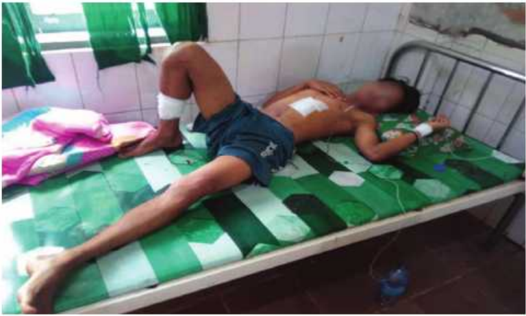
ကျောကရိတ်မြို့၊ နေပြည်သူများ ဒဏ်ရာရရှိမှုမှတ်တမ်းဓာတ်ပုံ။

ကျောကရိတ်မြို့၏ မြောက်ဘက်နှင့် အရှေ့ဘက်သို့ ဖရိုဖရဲဖြင့် ဆုတ်ခွာထွက်