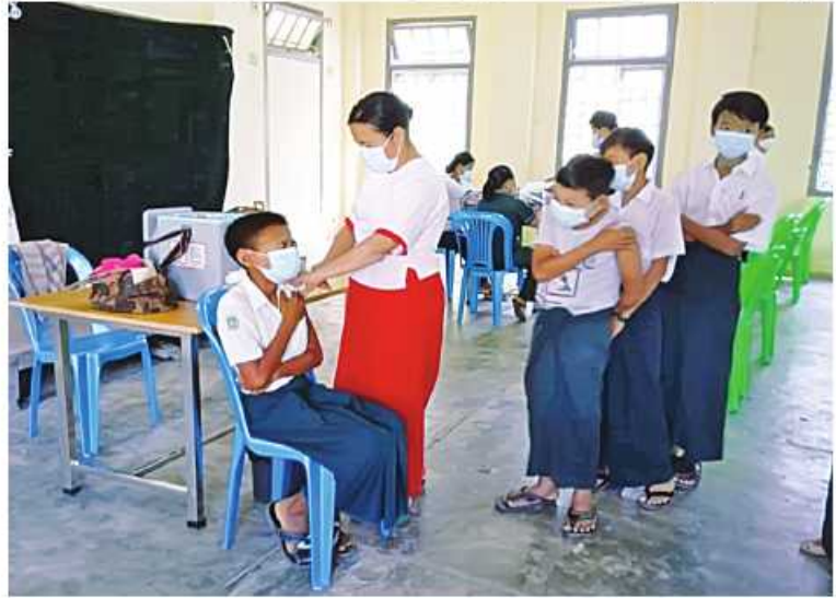
ရောဂါကာကွယ်ဆေးထိုးနှံပေးစဉ်၊ ရောဂါကာကွယ်ဆေးထိုးနှံပေးစဉ်။

နေပြည်တော် အောက်တိုဘာ ၂၁ ကိုဗစ်-၁၉ ရောဂါ ကာကွယ် ထိန်းချုပ်၊ ကုသရေးဆောင်ရွက်ရာတွင် ကာကွယ်ဆေး ထိုးနှံခြင်းသည် အဓိကအခန်းကဏ္ဍတွင် ပါဝင်သည့် လုပ်ငန်းတစ်ရပ်ဖြစ်သောကြောင့် တိုင်းဒေသကြီးနှင့် ပြည်နယ်အသီးသီးတို့၌ ကာကွယ်ဆေးထိုးနှံခြင်းကို အင်တိုက် အားတိုက် ဆောင်ရွက်လျက်ရှိရာ ယနေ့တွင် ရန်ကုန်တိုင်းဒေသကြီး တာဝန်ရှိသူနှင့် ဒေသခံပြည်သူ ၉၅ ဦး၊ ဧရာဝတီတိုင်း ဒေသကြီးအတွင်းရှိ မြို့နယ် ၂၆ မြို့နယ်တို့ ၌ ဒေသခံပြည်သူ ၄၉၁၂ ဦး၊ ရခိုင်ပြည်နယ် အတွင်းရှိ မြို့နယ် ၃၈ နှစ်မြို့နယ်တို့၌ ဒေသခံ ပြည်သူ ၈၅၄ ဦးနှင့် မန္တလေးတိုင်းဒေသကြီး အတွင်းရှိ ခရိုင် ၃ နှစ်မြို့နယ်တို့၌ ဒေသခံပြည်သူ ၅၇၄၅ ဦးတို့ကို တပ်မတော်မှ ဆေးအဖွဲ့ များက ပြည်သူဆေးရုံများမှ ဆရာဝန်များ၊ သက်ဆိုင်ရာ ကျန်းမာရေးဝန်ထမ်းများ၊ စေတနာ့ ဝန်ထမ်းများနှင့်ပူးပေါင်း၍ ကိုဗစ်-၁၉ ရောဂါ ကာကွယ်ဆေးထိုးနှံပေးခြင်းများ ဆောင်ရွက်ပေးသည်။ ထို့ပြင် ကိုဗစ်-၁၉ ရောဂါ ထိန်းချုပ် ကာကွယ်ရာတွင် အထောက်အကူဖြစ်စေ ရန်အတွက် Mask များကို ပြည်သူများ လက်ဝယ်အရောက် တိုင်းစစ်ဌာနချုပ် အသီးသီးမှ တာဝန်ရှိသူများက အခမဲ့ ပေးဝေလျှော့နှိမ်လျက်ရှိရာ ယနေ့တွင် ရန်ကုန်တိုင်းဒေသကြီးအတွင်းရှိ မြို့နယ် ၄၄ မြို့နယ်တို့မှ စာသင်ကျောင်းများ၊ ဈေးများ၊ လမ်းများ၊ မြို့အဝင်ဝိတ်များနှင့် လူစည်ကားရာနေရာများတွင် နယ်မြေခံ တပ်မတော်သားများက ခရိုင်၊ မြို့နယ်စီမံ အုပ်ချုပ်ရေးအဖွဲ့မှ တာဝန်ရှိသူများ၊ ဌာန ဆိုင်ရာဝန်ထမ်းများ၊ ပရဟိတအဖွဲ့များနှင့် ပူးပေါင်း၍ ကိုဗစ်-၁၉ ရောဂါကာကွယ်ရေး အတွက် အသိပညာပေးဆောင်ရွက်ခြင်း၊ Mask များတပ်ဆင်ပြီး သွားလာကြရန် လှုံ့ဆော်ခြင်းနှင့်Mask များကိုဒေသခံပြည်သူ များလက်ဝယ်အရောက် အခမဲ့ပေးဝေ လျှော့နှိမ်ခဲ့ကြောင်း သတင်းရရှိသည်။