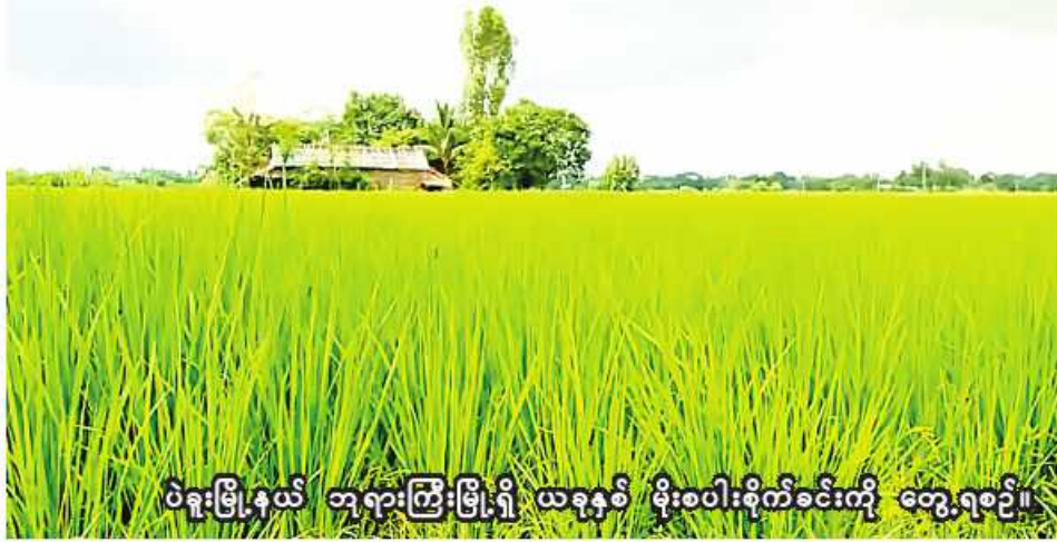
ပဲခူးမြို့နယ် ဘုရားကြီးမြို့ရှိ ယခုနှစ် မိုးစပါးစိုက်ခင်းကို တွေ့ရစဉ်။

ပဲခူး အောက်တိုဘာ ၂၁ ပဲခူးတိုင်းဒေသကြီး ပဲခူးမြို့နယ် ဘုရားကြီးမြို့တွင် လာမည့်ငွေစပါး စိုက်ပျိုးရာသီ၌ ငွေစပါးဧက ၁၆၃၀၀ စိုက်ပျိုးသွားမည်ဖြစ်ကြောင်း ပဲခူးမြို့နယ် စိုက်ပျိုးရေးဦးစီးဌာနမှ သိရသည်။ အဆိုပါ ပဲခူးမြို့နယ် ဘုရားကြီးမြို့တွင် ပြီးခဲ့သည့်နှစ် ငွေစပါးစိုက်ပျိုးရာသီ၌ ငွေစပါးဧက ၁၃၀၀၀ စိုက်ပျိုးခဲ့ပြီး ယခုနှစ် ငွေစပါး