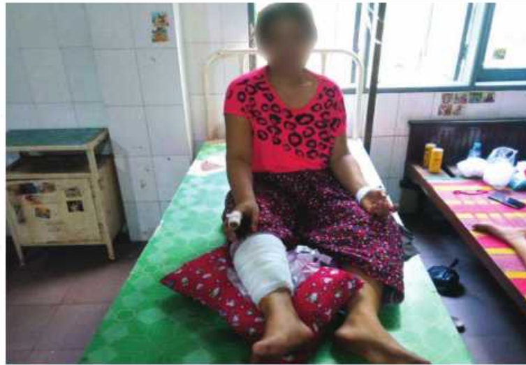
ကျောကရိတ်မြို့၊ နေပြည်သူတစ်ဦး ဒဏ်ရာရရှိမှုမှတ်တမ်းဓာတ်ပုံ။

ကျောကရိတ်မြို့၊ နေပြည်သူတစ်ဦး ကျောကရိတ်မြို့၊ နေပြည်သူတစ်ဦးသည် အင်အား သုံး၍ ဝင်ရောက်တိုက်ခိုက်ခဲ့ရာ လုံခြုံရေးတပ်ဖွဲ့ဝင်များက စနစ်တကျ ကြိုတင်စုဖွဲ့ အသင့်ဖြစ်မှုတို့ကြောင့်လည်း ကောင်းစွာ တာဝန်သိပြည်သူများက တိုက်ပွဲ အတွင်းမှ သောင်းကျန်းသူနေရာများအား သတင်းပေးပို့မှုကြောင့် လည်းကောင်း အကြမ်းဖက်သမားများ၏ ဝင်ရောက်တိုက် ခိုက်မှုကို ဝန်ထမ်းအိမ်ရာတစ်ခုကိုမှလွဲ၍ ထိရောက်စွာ တုံ့ပြန်တိုက်ခိုက်နိုင်ခဲ့သဖြင့် နံနက် ၁၀ နာရီခန့်တွင် သောင်းကျန်းသူ များ အထိနာ၍ ဆုတ်ခွာထွက်ပြေးသွားခဲ့ သည်။ ဝန်ထမ်းရပ်ကွက်အတွင်း ရောက်ရှိလာ သော သောင်းကျန်းသူများမှာ အရပ်သား ပြည်သူများနေထိုင်နေသည့် လူနေအိမ် များအတွင်းမှ အရပ်သားပြည်သူများနှင့် အဆောက်အအုံများကို အကာကွယ်ရယူ ကာ လူသားတံတိုင်းအဖြစ် အသုံးချတိုက် ခိုက်လာသဖြင့် လုံခြုံရေးတပ်ဖွဲ့ဝင်များ အနေဖြင့် အများပြည်သူနှင့်လူနေအဆောက် အအုံများကို ထိခိုက်မှုမရှိစေရေး ထိန်းထိန်း သိမ်းသိမ်း အကန့်အသတ်ဖြင့်တိုက်ခိုက် ရခြင်း၊ ဝိုင်းပတ်ချေမှုန်းနိုင်ရေး ဆောင်ရွက် ခဲ့ခြင်းတို့ကြောင့် ညနေ ၃ နာရီခန့်မှသာ သောင်းကျန်းသူများ ဝန်ထမ်းရပ်ကွက် အတွင်းမှ ကစဉ့်ကလျားဖြင့် ဆုတ်ခွာ ထွက်ပြေးသွားခဲ့သည်။