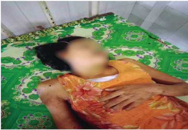
ကျောကရိတ်မြို့၊ နေပြည်သူတစ်ဦး သေဆုံးမှုမှတ်တမ်းဓာတ်ပုံ။