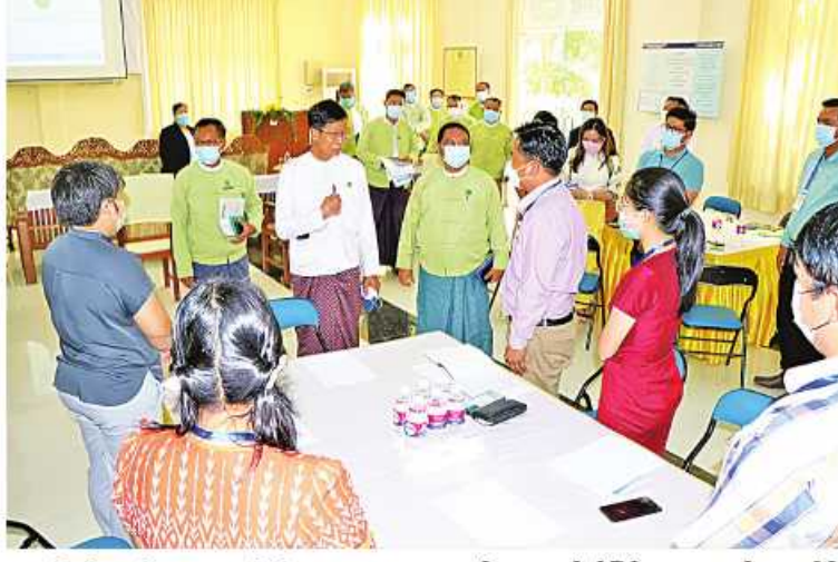
နေပြည်တော် အောက်တိုဘာ ၂၁ သမဝါယမနှင့် ကျေးလက်ဖွံ့ဖြိုးရေး ဝန်ကြီးဌာန ကျေးလက်ဒေသဖွံ့ဖြိုးတိုးတက်ရေးဦးစီးဌာနအနေဖြင့် ယနေ့ထိ အိမ်သုံး၊ အများသုံး ဆိုလာစနစ်နှင့် အသေးစား