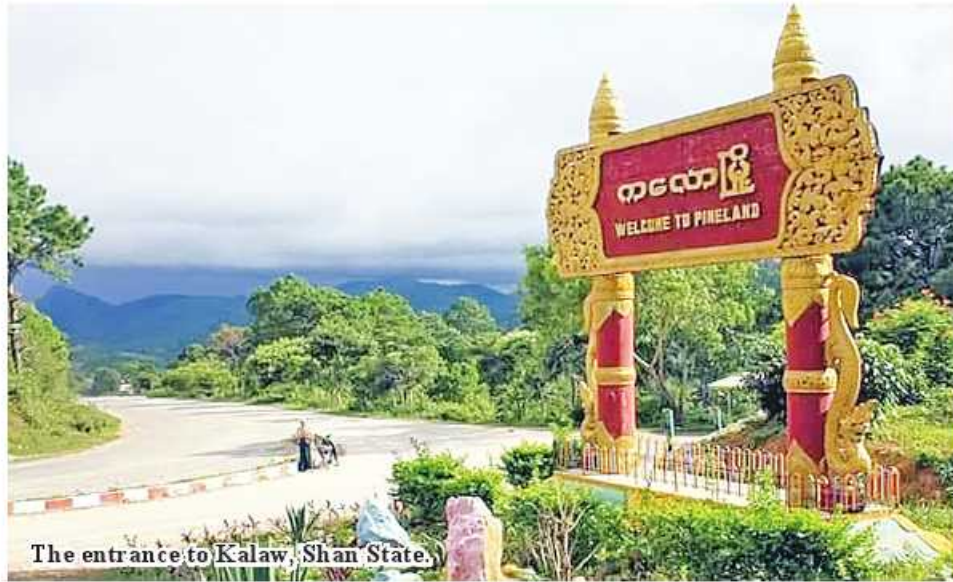
The entrance to Kalaw, Shan State.