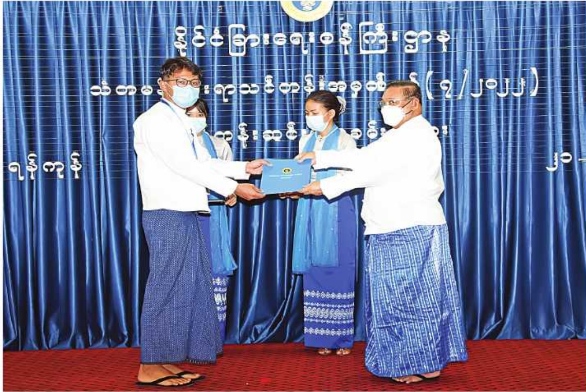
ရန်ကုန် အောက်တိုဘာ ၂၁ နိုင်ငံခြားရေးဝန်ကြီးဌာနတွင် အသစ် ခန့်အပ်လိုက်သော ဌာနဝန်ထမ်း-၂ တတိယ အတွင်းဝန် အရာထမ်းငယ်များအတွက် ဖွင့်လှစ်သည့် သံတမန်ရေးရာသင်တန်း (Course in Diplomacy-CID) အမှတ်

စဉ်(၇/၂၀၂၂) သင်တန်းဆင်းပွဲအခမ်းအနားကို ယနေ့နံနက် ၁၀ နာရီတွင် နိုင်ငံခြားရေးဝန်ကြီးဌာန (ရန်ကုန်)ရှိ ဝန်ထမ်းမင်းရာဇာခန်းမ၌ ကျင်းပရာ နိုင်ငံခြားရေးဝန်ကြီးဌာန ပြည်ထောင်စုဝန်ကြီး ဦးဝဏ္ဏမောင်လွင် တက်ရောက်၍ သင်တန်းဆင်းအမှာစကား ပြောကြားသည်။ သင်တန်းဆင်းပွဲ အခမ်းအနားသို့ သင်တန်းပို့ချပေးခဲ့ကြသည့် ဝါရင့်သံတမန်ကြီးများ၊ အငြိမ်းစားသံအမတ်ကြီးများ၊ ဘာသာရပ်ဆိုင်ရာ နည်းပြဆရာကြီး၊ ဆရာမကြီးများ၊ တက္ကသိုလ်အသီးသီးမှ ဆရာကြီး၊ ဆရာမကြီးများ၊ နိုင်ငံခြားရေးဝန်ကြီးဌာန မဟာဗျူဟာလေ့လာရေးနှင့် လေ့ကျင့်ရေးဦးစီးဌာန ညွှန်ကြားရေးမှူးချုပ်နှင့် တာဝန်ရှိသူများ၊ သင်တန်းသား၊ သင်တန်းသူများ တက်ရောက်ကြသည်။ အခမ်းအနားတွင် နိုင်ငံခြားရေးဝန်ကြီးဌာန ပြည်ထောင်စုဝန်ကြီးနှင့် သင်တန်းနည်းပြဆရာကြီး၊ ဆရာမကြီးများက သင်တန်းသား၊ သင်တန်းသူများကို သင်တန်းပြီးမြောက်ကြောင်း အောင်လက်မှတ်များနှင့် ထူးချွန်သင်တန်းသား၊ သင်တန်းသူများကို ဂုဏ်ပြုချီးမြှင့်ပေးအပ်ချီးမြှင့်ကြသည်။ အဆိုပါသင်တန်းကို နိုင်ငံခြားရေးဝန်ကြီးဌာန နေပြည်တော်တွင် ဩဂုတ် ၁၅ ရက်မှ စက်တင်ဘာ ၃၀ ရက်ထိ လည်းကောင်း၊ နိုင်ငံခြားရေးဝန်ကြီးဌာန (ရန်ကုန်)တွင် အောက်တိုဘာ ၃ ရက်မှ ၂၁ ရက်ထိလည်းကောင်း စုစုပေါင်း ရက်သတ္တ ၁၀ ပတ်ကြာ ဖွင့်လှစ်ပို့ချပေးခဲ့ပြီး အရာထမ်းငယ်များ၏ အရည်အသွေးမြှင့်တင်ရန်နှင့် ဘာသာရပ်ဆိုင်ရာ ဝဟုသုတကြွယ်ဝစေရန်အတွက် နိုင်ငံခြားရေးမူဝါဒ၊ နိုင်ငံတကာဆက်ဆံရေး၊ မျက်မှောက်ခေတ် နိုင်ငံတကာရေးရာများ၊ သံတမန်ရေးရာဘာသာရပ်များ၊ အပြည်ပြည်ဆိုင်ရာဥပဒေများ၊ အထွေထွေ ဝဟုသုတများနှင့် လက်တွေ့အသုံးချ အင်္ဂလိပ်စာဘာသာရပ်များကို စာတွေ့၊ လက်တွေ့ သင်ကြားပို့ချပေးခဲ့ခြင်းဖြစ်ကြောင်း သတင်းရရှိသည်။ (သတင်းစဉ်)