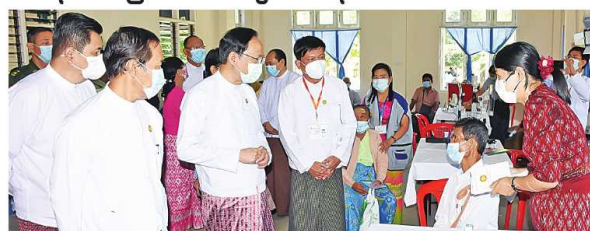
ပြည်ထောင်စုဝန်ကြီး ဒေါက်တာသက်နိုင်ဝင်း မျက်စိရောဂါဝေဒနာရှင်များကို တွေ့ဆုံပြီး အားပေးကတားပြောကြားစဉ်

ပြည်ထောင်စုဝန်ကြီး ဒေါက်တာသက်နိုင်ဝင်း ကမ္ဘာ့မျက်မမြင်ပပျောက်ရေးနေ့အထိမ်းအမှတ် ကွင်းဆင်းမျက်စိစမ်းသပ်ကုသပေးခြင်း အစီအစဉ်တက်ရောက်