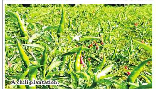
A chili plantation.