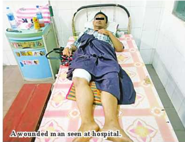
A wounded man seen at hospital.

Nay Pyi Taw October 21 Battalions under KNU/KNLA Brigade-6, KKO (Split) group, and so-called PDF terrorists under NUG and CRPH this morning launched fire into Kawkareik of Kayin State with heavy weapons and entered and attacked public residences, staff housings, offices and departmental buildings.