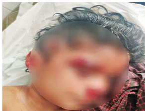
GNU / KNLA တပ်မဟာ(၆) လက်အောက်ခံတပ်ရင်းများ၊ KKO (ခွဲထွက်) အဖွဲ့နှင့် NUG၊ CRPHတို့၏ လက်ဝေခံ PDF အမည်ခံ အကြမ်းဖက်သမားများ၏ပစ်ခတ်မှုကြောင့် ကော့ကရိတ်မြို့၊ အမှတ်(၇)ရပ်ကွက်ရှိ ကိုးနှစ်အရွယ်ကလေးငယ်တစ်ဦးသေဆုံးခဲ့မှုကို တွေ့ရစဉ်။

နေ့လယ်ပိုင်းတွင်လည်း GNU/KNLA တပ်မဟာ(၆)လက်အောက်ခံတပ်ရင်းများ၊ KKO(ခွဲထွက်)အဖွဲ့နှင့် NUG၊ CRPH တို့၏လက်ဝေခံ PDF အမည်ခံအကြမ်းဖက်သမားများအနေဖြင့် ကရင်ပြည်နယ် ကော့ကရိတ်မြို့အတွင်းသို့ မြို့၏ အရှေ့မြောက်ဘက် မီတာ ၁၅၀၀ ခန့်အကွာမှ လက်နက်ကြီးများဖြင့် လာရောက်နှောင့်ယှက်ပစ်ခတ်တိုက်ခိုက်ခဲ့သည်။ ထိုကဲ့သို့ အကြမ်းဖက်သမားများ၏ ရည်ရွယ်ချက်ရှိရှိဖြင့် လူနေရပ်ကွက်များအတွင်းသို့ လက်နက်ကြီးများဖြင့် ပစ်ခတ်တိုက်ခိုက်ခဲ့မှုကြောင့် အမှတ်