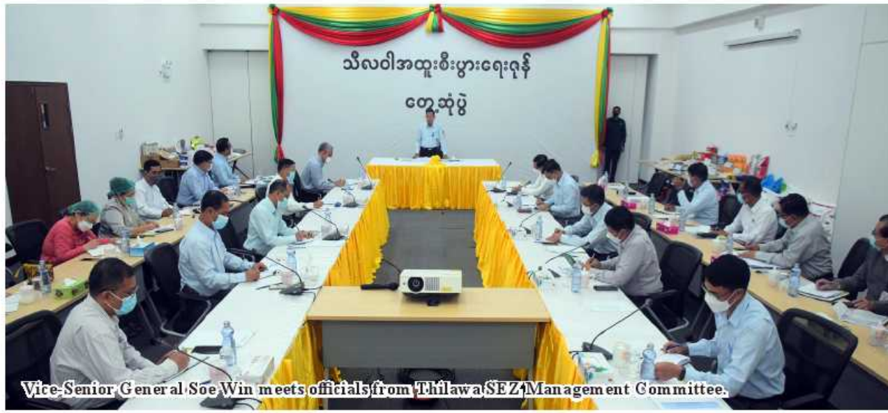
Vice-Senior General Soe Win meets officials from Thilawa SEZ Management Committee.