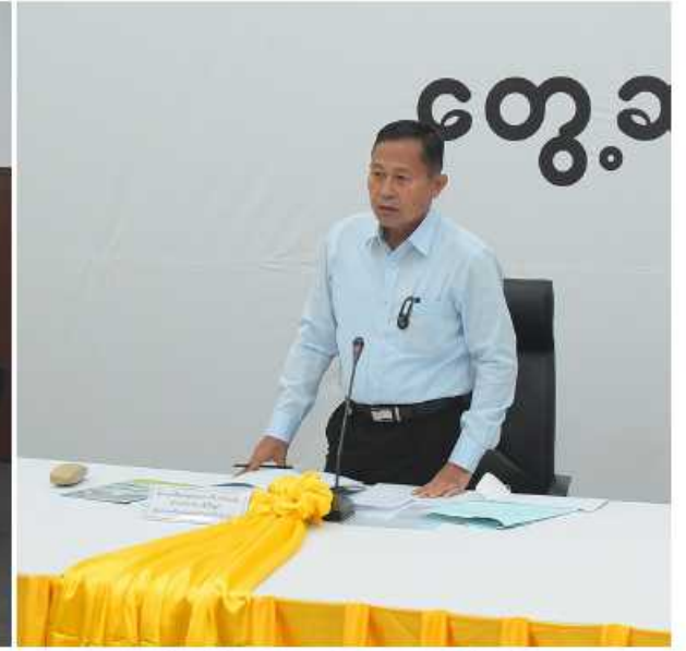
နိုင်ငံတော်စီမံအုပ်ချုပ်ရေးကောင်စီဒုတိယဥက္ကဋ္ဌ ဒုတိယတပ်မတော်ကာကွယ်ရေးဦးစီးချုပ် ကာကွယ်ရေးဦးစီးချုပ်(ကြည်း) ဒုတိယဗိုလ်ချုပ်မှူးကြီးစိုးဝင်း သီလဝါအထူးစီးပွားရေးရန်စီမံခန့်ခွဲမှုကော်မတီမှ တာဝန်ရှိသူများကို တွေ့ဆုံအမှာစကားပြောကြားစဉ်။

၂၀ ရှေ့ပိုးမှအဆက် လုပ်ငန်း ဆက်လက်ဆောင်ရွက်သွားမည် အခြေအနေများကို ရှင်းလင်းတင်ပြသည်။ ဆက်လက်၍ တက်ရောက်လာကြသူများက အထူးစီးပွားရေးဇုန်အတွင်းရင်းနှီးမြှုပ်နှံကာ လုပ်ငန်းများဆောင်ရွက်နေမှုများကို