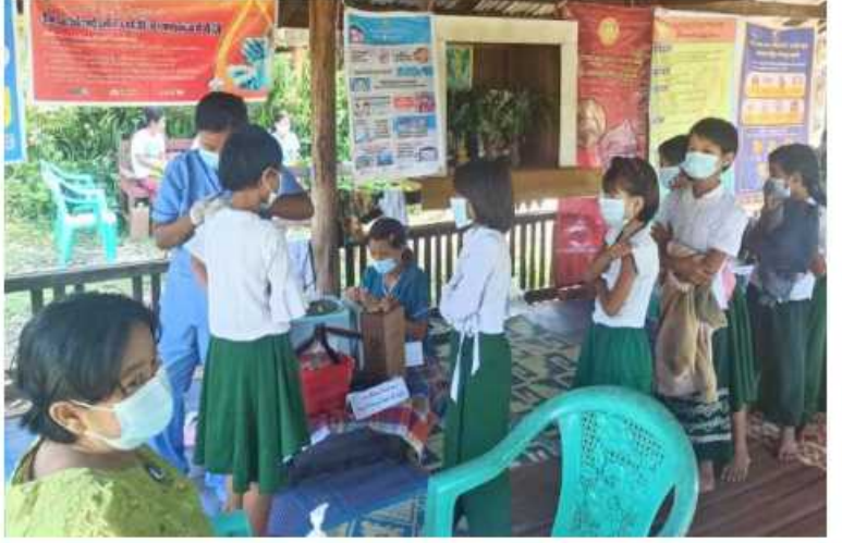
မန္တလေးတိုင်းဒေသကြီးအတွင်းရှိ ကျောင်းသား၊ ကျောင်းသူများကို ကိုဗစ်-၁၉ ရောဂါ ကာကွယ်ဆေး ထိုးနှံပေးစဉ်။

ဆေးထိုးနှံပေးခြင်းများ ဆောင်ရွက် ပေးသည်။ ထို့ပြင် ကိုဗစ်-၁၉ ရောဂါ ထိန်းချုပ် ကာကွယ်ရာတွင် အထောက်အကူဖြစ်စေ ရန်အတွက် Mask များကို ပြည်သူများ လက်ဝယ်အရောက် တိုင်းစစ်ဌာနချုပ် အသီးသီးမှ တာဝန်ရှိသူများက အခမဲ့ ပေးဝေလျှော့ဒါနိုးလျက်ရှိရာ ယနေ့တွင် တနင်္သာရီတိုင်း ဒေသကြီးအတွင်းရှိ မြို့နယ် သုံးမြို့နယ်နှင့် ရန်ကုန်တိုင်း ဒေသကြီးအတွင်းရှိ မြို့နယ် ၄၄ မြို့နယ်တို့၌ စာသင်ကျောင်းများ၊ ဈေးများ၊ လမ်းများ၊ မြို့အဝင်ဝိတ်များနှင့် လူစည်ကားရာနေရာ များတွင် နယ်မြေခံတပ်မတော်သားများက ခရိုင်၊ မြို့နယ်စီမံအုပ်ချုပ်ရေးအဖွဲ့မှ တာဝန်ရှိသူများ၊ ဌာနဆိုင်ရာဝန်ထမ်းများ၊ ပရဟိတအဖွဲ့များနှင့်ပူးပေါင်း၍ ကိုဗစ်