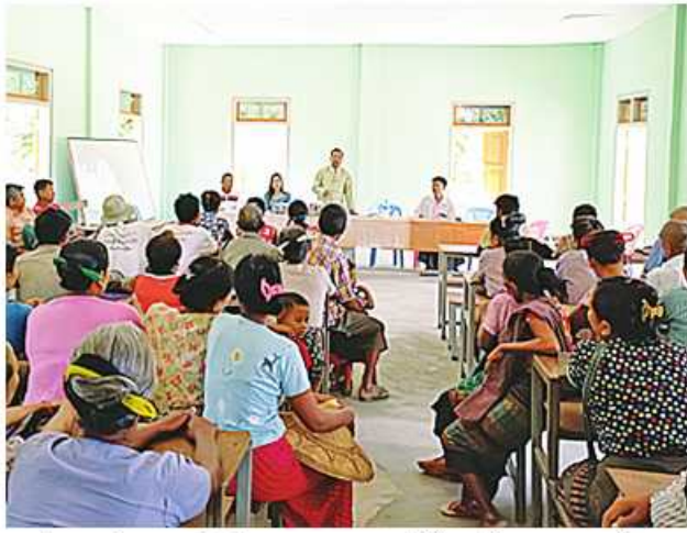
နတ်မောက် အောက်တိုဘာ ၂၇ မောက်မြို့နယ် ကျေးလက်ဒေသ မကျေးတိုင်းဒေသကြီး နတ် ဖွံ့ဖြိုးတိုးတက်ရေး ဦးစီးဌာနက