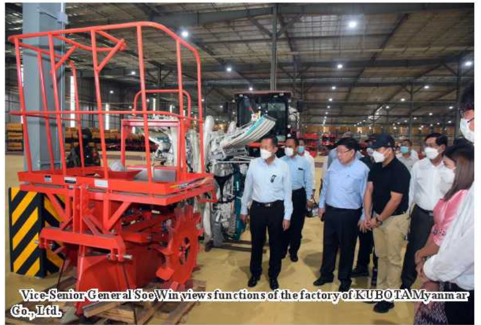
Vice-Senior General Soe Win views functions of the factory of KUBOTA Myanmar Co., Ltd.

be made for attracting more companies to enter the zone. As now is time of striving for the all-round development of the nation, job creation will contribute to development of State economy. As such, coordination must be done to sell remaining land pots. Then, the Vice-Senior General and party viewed the products manufactured by Thilawa SEZ and have necessary instructions to officials at the hall of the zone. The Vice-Senior General also viewed functions of the factory of KUBOTA Myanmar Co., Ltd in the zone, asked he wanted to know and coordinated necessary measures. A total of 114 companies from 31 countries operate their businesses at Thilawa SEZ with investments. 100