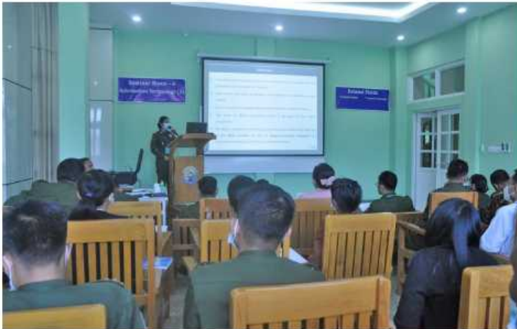
စစ်တက္ကသိုလ်အဆင့်မြင့်ပညာပဟိုဠာနွှာ သိပ္ပံနှင့်နည်းပညာဆိုင်ရာဖွံ့ဖြိုးတိုးတက်ရေး ကွန်ဖရင့်(၂၀၂၂)တွင် စာတမ်းတင်သွင်းသူတစ်ဦးက စာတမ်းဖတ်ကြားစဉ်။

ပြင်ဦးလွင် အောက်တိုဘာ ၂၇ တပ်မတော်အနေဖြင့် သိပ္ပံနှင့် နည်းပညာဆိုင်ရာများ အထောက်အကူပြု နိုင်ရန်နှင့် လူ့စွမ်းအားအရင်းအမြစ် ဖွံ့ဖြိုးတိုးတက်စေရန်ရည်ရွယ်၍ သိပ္ပံနှင့် နည်းပညာဆိုင်ရာ ဖွံ့ဖြိုးတိုးတက်ရေး ကွန်ဖရင့်(၂၀၂၂) (Conference on Science and Technology Development-2022) (CSTD-2022) ဖွင့်ပွဲ အခမ်းအနားကို ယနေ့နံနက်ပိုင်းတွင် ပြင်ဦးလွင်တပ်နယ် စစ်တက္ကသိုလ် အဆင့်မြင့်စာပေပညာပဟိုဠာနွှာ ငါးထပ် စာသင်ဆောင်ရှိ Multifunction Hall ၌ ကိုဗစ်-၁၉ ရောဂါ စည်းကမ်းသတ်မှတ်ချက် များနှင့်အညီ ကျင်းပပြုလုပ်သည်။ ဦးစွာ ညှိနှိုင်းကွပ်ကဲရေးမှူး(ကြည်း၊ ရေ၊ လေ) ဝိုလ်ချုပ်ကြီးမောင်မောင်အေးက အဖွင့်အမှာစကားပြောကြားပြီး အခမ်း အနားသို့ တက်ရောက်လာကြသူများနှင့် အတူ တင်သွင်းခင်းကျင်းပြုသထားသည့် သိပ္ပံနှင့်နည်းပညာဆိုင်ရာပို့စတာ ၂၃ စောင် ကို လှည့်လည်ကြည့်ရှုစစ်ဆေးရာ ပို့စတာ ရှင်များက ရှင်းလင်းတင်ပြကြသည်။ ထို့နောက် ဖိတ်ကြားထားသော