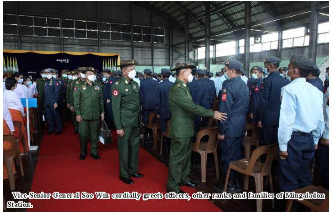
Vice-Senior General Soe Win cordially greets officers, other ranks and families of Mingaladon Station.

looked into the requirements presented by every individual member of the attendees in coordination with officials. The Vice-Senior General presented foodstuff for officers, other ranks and families through officials. The Vice-Senior General and party cordially greeted the attendees. 100