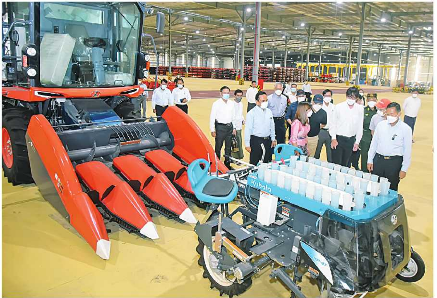
နိုင်ငံတော်စီမံအုပ်ချုပ်ရေးကောင်စီဒုတိယဥက္ကဋ္ဌ ဒုတိယတပ်မတော်ကာကွယ်ရေးဦးစီးချုပ် ကာကွယ်ရေးဦးစီးချုပ်(ကြည်း) ဒုတိယဗိုလ်ချုပ်မှူးကြီးစိုးဝင်း၊ သီလဝါအထူးစီးပွားရေးဇုန်အတွင်းရှိ KUBOTA Myanmar Co.,Ltd. စက်ရုံအတွင်း လှည့်လည်ကြည့်ရှုစဉ်။