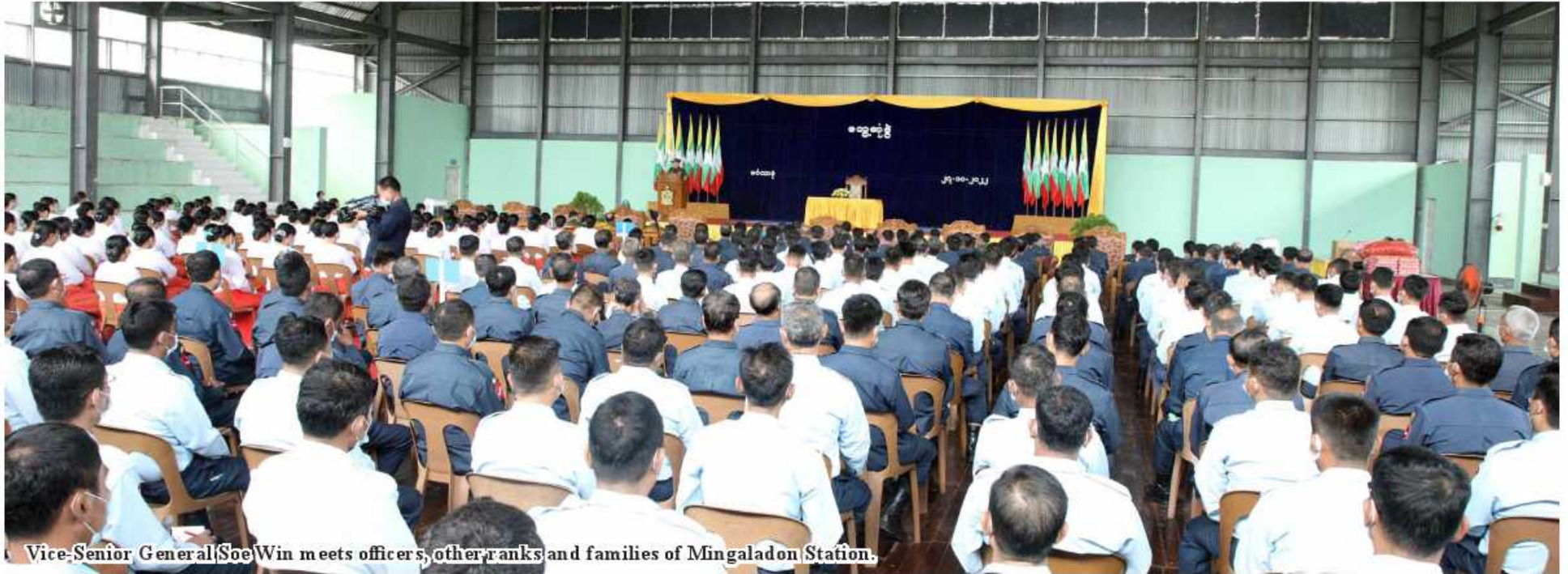
Vice-Senior General Soe Win meets officers, other ranks and families of Mingaladon Station.

Nay Pyi Taw October 27 Vice Chairman of State Administration Council Deputy Commander-in-Chief of Defence Services Commander-in-Chief (Army) Vice-Senior General Soe Win, accompanied by senior military officers from Office of Commander-in-Chief, the Yangon Command commander and officials, met officers, other ranks and families of Mingaladon Station this morning at the station hall.