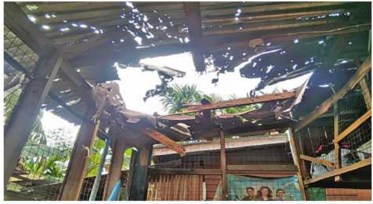
GNU / KNLA တပ်မဟာ(၆) လက်အောက်ခံတပ်ရင်းများ၊ KKO (ခွဲထွက်) အဖွဲ့နှင့် NUG၊ CRPHတို့၏လက်ဝေခံ PDF အမည်ခံအကြမ်းဖက်သမားများ၏ ပစ်ခတ်မှုကြောင့် ကော့ကရိတ်မြို့၊ အမှတ်(၇)ရပ်ကွက်ရှိ လူနေအိမ်များထိခိုက်ပျက်စီးမှုကို တွေ့ရစဉ်။