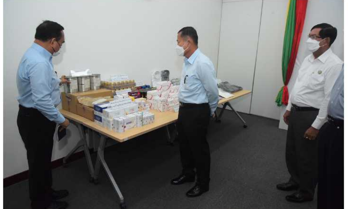
နိုင်ငံတော်စီမံအုပ်ချုပ်ရေးကောင်စီဒုတိယဥက္ကဋ္ဌ ဒုတိယတပ်မတော်ကာကွယ်ရေးဦးစီးချုပ် ကာကွယ်ရေးဦးစီးချုပ်(ကြည်း) ဒုတိယဗိုလ်ချုပ်မှူးကြီးစိုးဝင်း စင်းကျင်းပြသထားသည့် သီလဝါအထူးစီးပွားရေးရန်မှ ထုတ်လုပ်သော ကုန်ပစ္စည်းများကို ကြည့်ရှုစဉ်။

လာရောက်ရင်းနှီးမြှုပ်နှံသည့် နိုင်ငံများမှ ကုမ္ပဏီများ၏ ယုံကြည်မှုရရှိနေအောင် ဆောင်ရွက်ပေးရန်လိုကြောင်း၊ ငွေကြေးဆိုင်ရာ အရေးယူဆောင်ရွက်ရေးအဖွဲ့ (Financial Action Task Force-FATF) ၏ ထုတ်ပြန်ချက်နှင့်ပတ်သက်၍ ဗဟိုဘဏ်ကလည်း တရားဝင်ရှင်းလင်းထားပြီးဖြစ်၍ ပုံမှန်ငွေကြေးစီးဆင်းမှုနှင့် နိုင်ငံစီးပွားရေးပုံမှန်လည်ပတ်နေမှုကို သံသယ