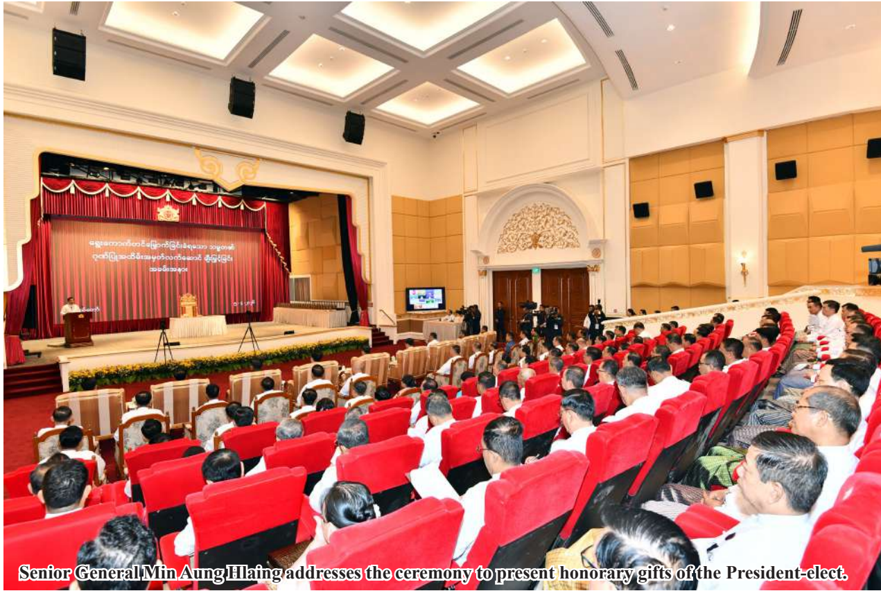
Senior General Min Aung Hlaing addresses the ceremony to present honorary gifts of the President-elect.