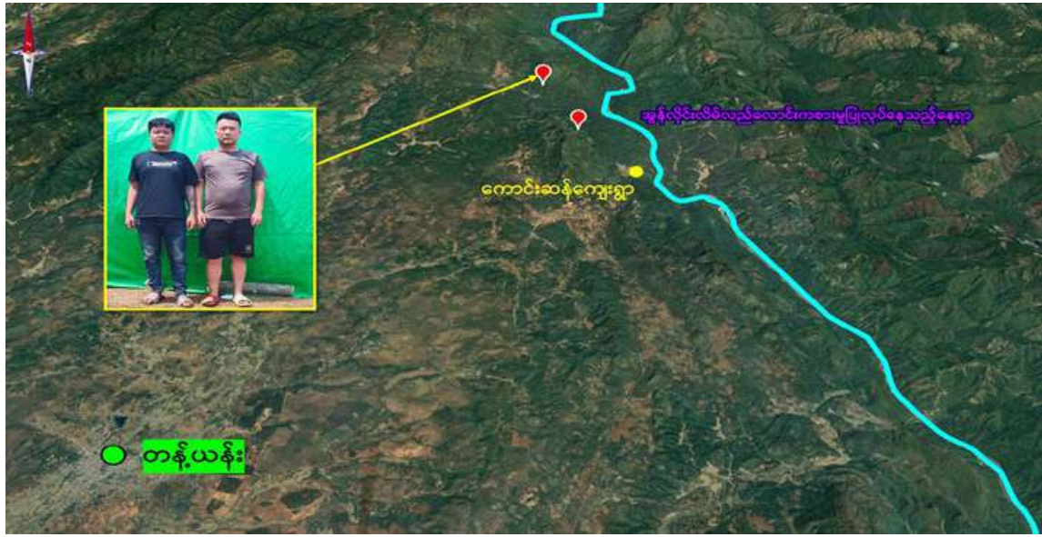
တန့်ယန်းမြို့နယ်အတွင်း အွန်လိုင်းလိမ်လည်လောင်းကစားမှုကျူးလွန်ရာတွင် ပါဝင်ခဲ့သည့် တရုတ်နိုင်ငံသား နှစ်ဦးကို ထပ်မံဖမ်းဆီးရမိခဲ့သည့် နေရာပြပုံ။

နေပြည်တော် ဧပြီ ၅ - မြန်မာနိုင်ငံ အစိုးရအနေဖြင့် တစ်ကမ္ဘာလုံးကို အန္တရာယ်ပေးနေသည့် အွန်လိုင်းလိမ်လည်မှုများ၊ အွန်လိုင်းလောင်းကစားမှုများ တိုက်ဖျက်ရေး လုပ်ငန်းစဉ်များကို အမျိုးသားရေးတာဝန်