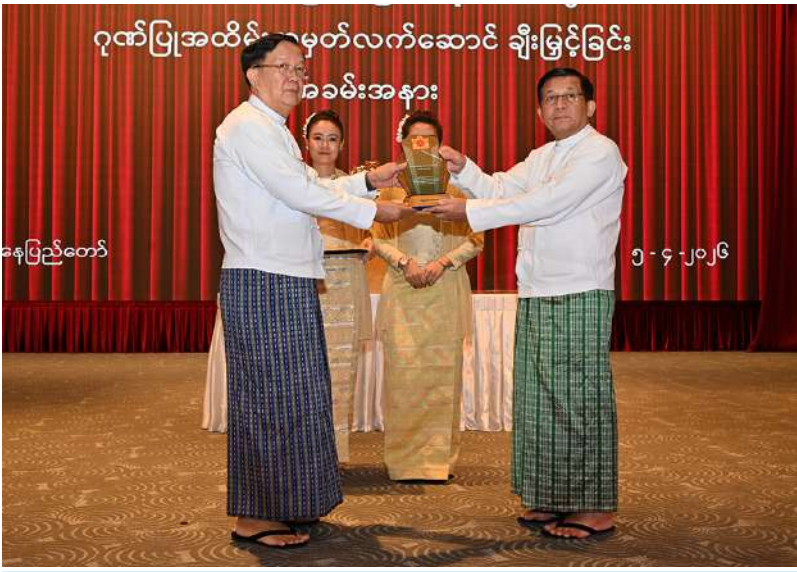
ရွေးကောက်တင်မြောက်ခြင်းခံရသော သမ္မတ နိုင်ငံတော်လုံခြုံရေးနှင့် အေးချမ်းသာယာရေးကော်မရှင်ဥက္ကဋ္ဌ ဗိုလ်ချုပ်မှူးကြီးမင်းအောင်လှိုင် နိုင်ငံတော်လုံခြုံရေးနှင့် အေးချမ်းသာယာရေးကော်မရှင် ကော်မရှင်အဖွဲ့ဝင် ဦးအောင်လင်းဒွေးအား ဂုဏ်ပြုအထိမ်းအမှတ်လက်ဆောင် ပေးအပ်ချီးမြှင့်စဉ်။

ထိုသို့လူပုဂ္ဂိုလ်များကြားမှ ယခုအခမ်းအနားကို တက်ရောက်ပေးကြသည့် ပုဂ္ဂိုလ်များသည် မိမိတို့တာဝန်ယူခဲ့သည့် ငါးနှစ်တာကာလ အစအဆုံးတွင်ပေးအပ်သည့် တာဝန်များကို သစ္စာရှိရှိဖြင့် ကျေပွန်အောင်ကြိုးစားထမ်းဆောင်ခဲ့သည်ကို တွေ့ရကြောင်း၊ ထို့ကြောင့်လည်း မကြာမီရက်ပိုင်းအတွင်း၌ နိုင်ငံတော်ကို ဒီမိုကရေစီစနစ်ဖြင့် ဖွံ့ဖြိုးတိုးတက်အောင် ဆက်လက်ဆောင်ရွက်မည့် အစိုးရသစ်ကို သင့်တင့်ကောင်းမွန်သည့် အခြေခံများဖြင့် လွှဲပြောင်းပေးနိုင်တော့မည်