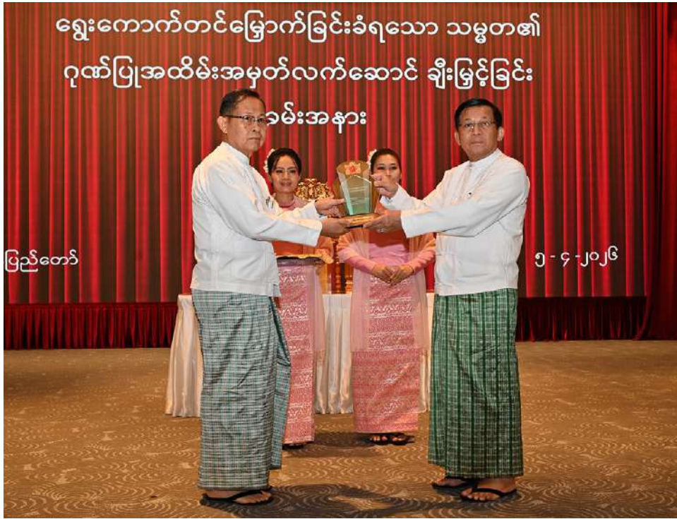
နေပြည်တော်