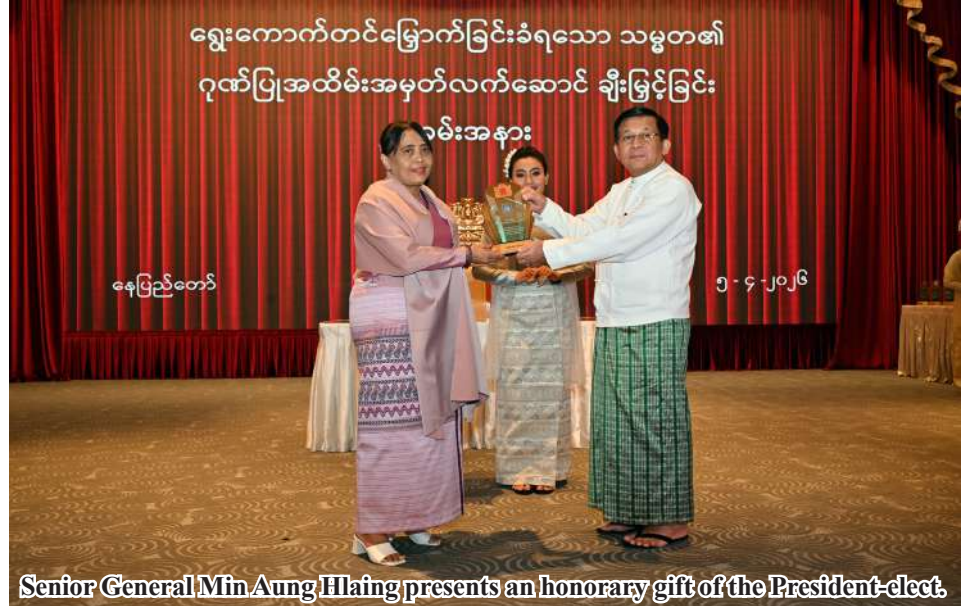
Senior General Min Aung Hlaing presents an honorary gift of the President-elect.

Furthermore, the country was struck by successive natural disasters, including Cyclone Mocha, Typhoon Yagi, and a massive Mandalay earthquake. These disturbances, terrorist acts, and natural calamities resulted in loss of life and widespread destruction, stalling the country's early-stage progress and causing large-scale infra-