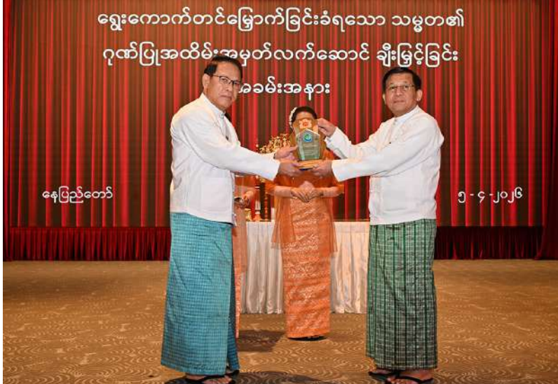
ရွေးကောက်တင်မြောက်ခြင်းခံရသော သမ္မတ၏ ရွေးကော်မရှင်ဥက္ကဋ္ဌ ဗိုလ်ချုပ်မှူးကြီးမင်းအောင်လှိုင် ပြန်ကြားရေးဝန်ကြီးဌာန ပြည်ထောင်စုဝန်ကြီး ဦးမောင်မောင်အုန်းအား ဂုဏ်ပြုအထိမ်းအမှတ်လက်ဆောင်ပေးအပ်ချီးမြှင့်စဉ်။

လမ်းကြောင်းပေါ် ပြန်လည်တည်မတ်လွှဲပြောင်းပေးနိုင်ခဲ့သော သမိုင်းမော်ကွန်းတစ်ခုကိုစိုက်ထူနိုင်ခဲ့သဖြင့် ဝမ်းသာအားရဖြစ်ရကြောင်း၊ထို့ကြောင့် မိမိနှင့်အတူ ငါးနှစ်တာကာလလက်တွဲပြီး တာဝန်ကျေခဲ့ကြသည့် ယခုအခမ်းအနားကို တက်ရောက်လာကြသူများအားလုံးကို လေးလေးစားစား