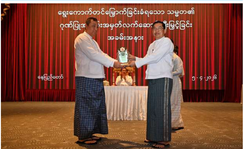
နေပြည်တော်

ရွေးကောက်တင်မြှောက်ခြင်းခံရသောသမ္မတ နိုင်ငံတော်လုံခြုံရေးနှင့် အေးချမ်းသာယာ ရေးကော်မရှင်ဥက္ကဋ္ဌ ဗိုလ်ချုပ်မှူးကြီးမင်းအောင်လှိုင် နိုင်ငံတော်သမ္မတရုံးဝန်ကြီးဌာန(၁) ပြည်ထောင်စုဝန်ကြီး ဦးတင်အောင်စန်းအား ဂုဏ်ပြုအထိမ်းအမှတ်လက်ဆောင် ပေးအပ် ချီးမြှင့်စဉ်။