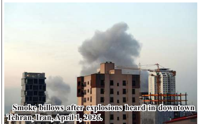
Smoke billows after explosions heard in downtown Tehran, Iran, April 1, 2026.

Tensions have heightened in the Middle East since the United States and Israel launched joint strikes on Iran starting Feb. 28, with Tehran responding with attacks on Israeli and U.S. interests across the region.