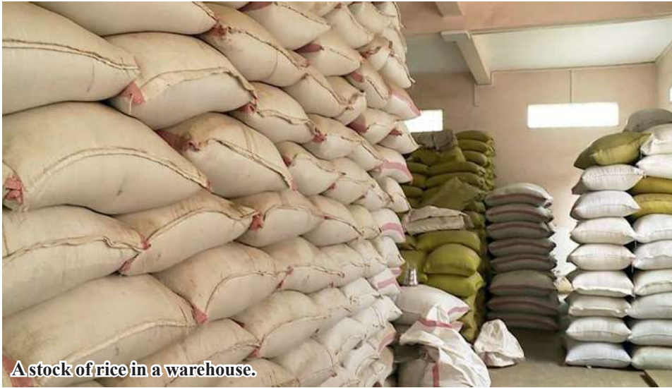
A stock of rice in a warehouse.

Mawlamyinegyun April 5 From Mawlamyinegyun Township to the Yangon market, only 32,000 bags (24 pyi each) of black gram (24 pyi per bag) of black gram were exported and sold during the one-month period in February. In March, exports increased to as many as 45,000 bags within a single month. Local merchants from Mawlamyinegyun Township of Ayeyawady Region shipped 45,000 bags of black gram to Yangon market in March, said Daw Thida, the owner of pulses and beans trading depot in Mawlamyinegyun Township.