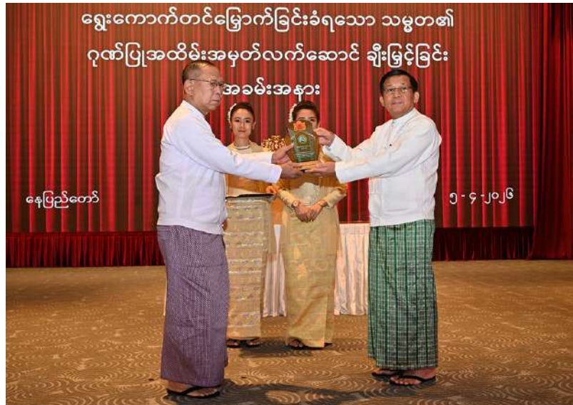
နေပြည်တော်