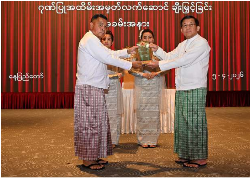
ရွေးကောက်တင်မြောက်ခြင်းခံရသော သမ္မတ နိုင်ငံတော်လုံခြုံရေးနှင့် အေးချမ်းသာယာရေးကော်မရှင်ဥက္ကဋ္ဌ ဗိုလ်ချုပ်မှူးကြီးမင်းအောင်လှိုင် နိုင်ငံတော်လုံခြုံရေးနှင့် အေးချမ်းသာယာရေးကော်မရှင် အတွင်းရေးမှူး တပ်မတော်ကာကွယ်ရေးဦးစီးချုပ် ဗိုလ်ချုပ်ကြီး ရဲဝင်းဦးအား ဂုဏ်ပြုအထိမ်းအမှတ်လက်ဆောင်ပေးအပ်ချီးမြှင့်စဉ်။