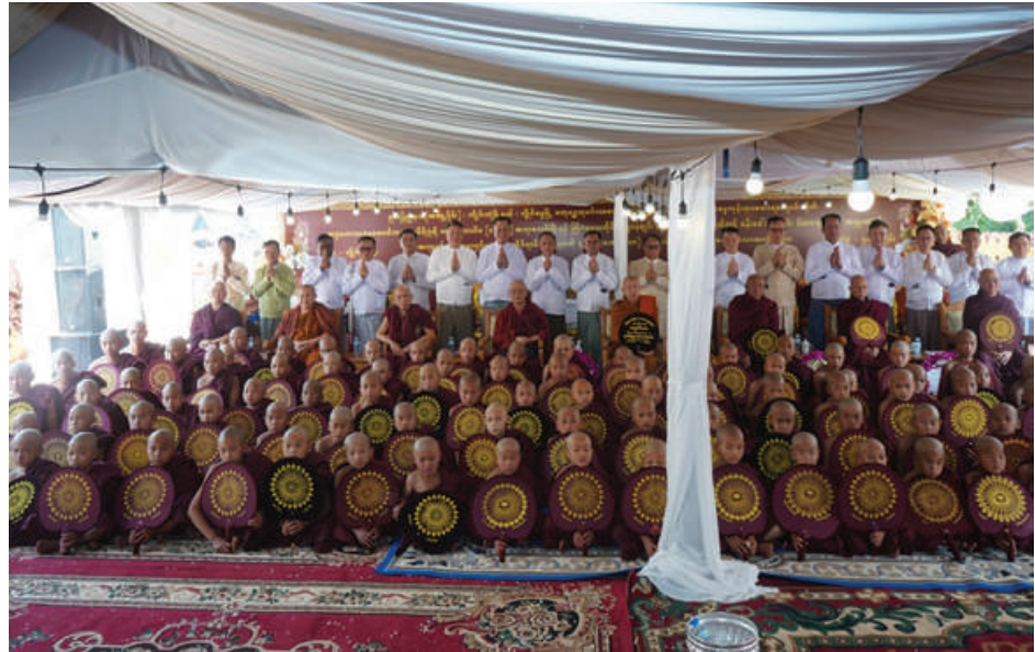
ရှမ်းပြည်နယ် (အရှေ့ပိုင်း) ကျိုင်းတုံမြို့နယ် လွိုင်မွေမြို့၌ ဌာနဆိုင်ရာ မိသားစုများ စုပေါင်းကာ ရှင်သာမဏေ ၁၀၈ ပါး ရှင်ပြုအလှူ မင်္ဂလာပွဲ ကျင်းပပြုလုပ်စဉ်။

နေပြည်တော် ဧပြီ ၅ - ရှမ်းပြည်နယ်(အရှေ့ပိုင်း) ကျိုင်းတုံ မြို့နယ် လွိုင်မွေမြို့၌ ဌာနဆိုင်ရာ မိသားစုများစုပေါင်းကာ ရှင်သာမဏေ ၁၀၈ ပါး ရှင်ပြုအလှူမင်္ဂလာပွဲကို ယနေ့နံနက်ပိုင်းတွင် လွိုင်မွေမြို့ စတုရံသုမင်္ဂလာ စေတီတော်ရင်ပြင်၌ ကျင်းပပြုလုပ်ရာ သီလဓမ္မကုန်းသာ တောရကျောင်းတိုက်ဆရာတော် အဂ္ဂ မဟာသဒ္ဓမ္မဇောတိကဓဇ သီရိပျံချီဘဒ္ဒန္တ ကောဝိဒ (စတီပိတ်ဆရာတော်)အမှူးပြု သော ဆရာတော်၊ သံဃာတော်များ ကြွရောက်တော်မူကြပြီး တြိဂံဒေသတိုင်း