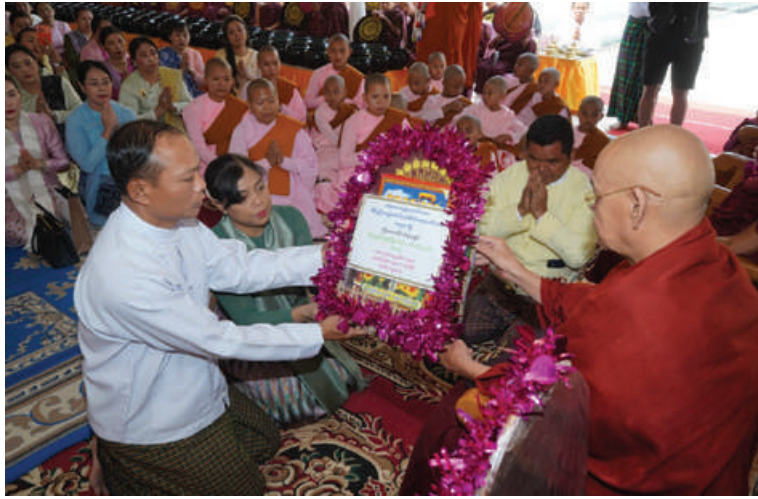
ဆရာတော်ထံ တြိဂံဒေသတိုင်းစစ်ဌာနချုပ် တိုင်းမှူး ဗိုလ်ချုပ်စိုးမြတ်ထွဋ် သင်္ကန်းနှင့်လှူဖွယ်ဝတ္ထုပစ္စည်းများ ဆက်ကပ်လှူဒါန်းစဉ်။