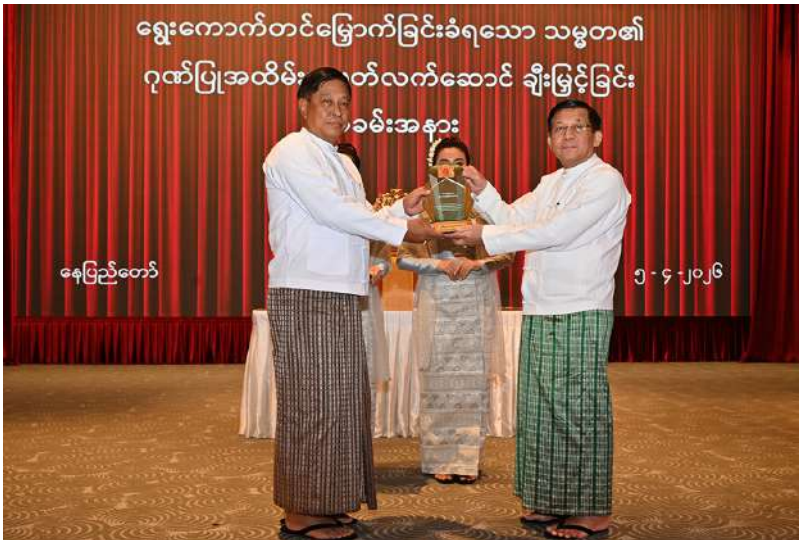
နေပြည်တော်

နိုင်ငံတော်လုံခြုံရေးနှင့် အေးချမ်းသာယာရေးကော်မရှင် ဒုတိယဥက္ကဋ္ဌ ဒုတိယ ဗိုလ်ချုပ်မှူးကြီးစိုးဝင်း ပြည်ထောင်စုတရားလွှတ်တော်ချုပ် တရားသူကြီး ဦးသိန်းကိုကို အား ရွေးကောက်တင်မြှောက်ခြင်းခံရသော သမ္မတ၏ ဂုဏ်ပြုအထိမ်းအမှတ်လက်ဆောင် ပေးအပ်ချီးမြှင့်စဉ်။