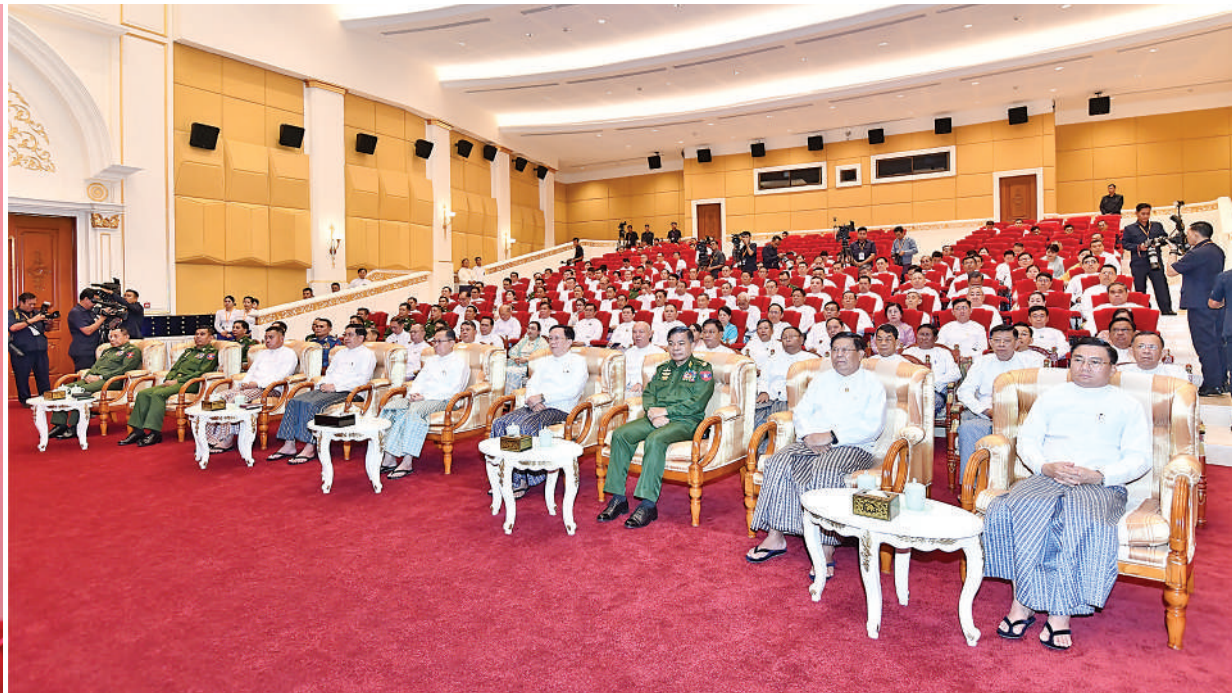
ရွေးကောက်တင်မြှောက်ခြင်းခံရသော သမ္မတ နိုင်ငံတော်လုံခြုံရေးနှင့်အေးချမ်းသာယာရေးကော်မရှင်ဥက္ကဋ္ဌ ဗိုလ်ချုပ်မှူးကြီးမင်းအောင်လှိုင် ရွေးကောက်တင်မြှောက်ခြင်းခံရသော သမ္မတ၏ ဂုဏ်ပြုအထိမ်းအမှတ် လက်ဆောင်ချီးမြှင့်ခြင်းအခမ်းအနားတွင် အမှာစကားပြောကြားစဉ်။

နေပြည်တော် ဧပြီ ၅ ဆောင်ခန်းမ၌ ကျင်းပပြုလုပ်ရာ ရွေးကောက် လက်ဆောင်များချီးမြှင့်သည်။ ရွေးကောက်တင်မြှောက်ခြင်းခံရသော သမ္မတ၏ ဂုဏ်ပြုအထိမ်းအမှတ်လက်ဆောင် ချီးမြှင့်ခြင်း ရေးနှင့် အေးချမ်းသာယာရေးကော်မရှင်ဥက္ကဋ္ဌ ဗိုလ်ချုပ်မှူးကြီးမင်းအောင်လှိုင် တက်ရောက်အမှာ စကားပြောကြားပြီး ဂုဏ်ပြုအထိမ်းအမှတ် နိုင်ငံတော်လုံခြုံရေးနှင့် အေးချမ်းသာယာရေးကော်မရှင် ခုတိယဥက္ကဋ္ဌ ဒုတိယဗိုလ်ချုပ်မှူးကြီးစိုးဝင်း၊ ကော်မရှင်အဖွဲ့ဝင် နိုင်ငံတော်ဝန်ကြီးချုပ် ဦးညိုစော၊ ကော်မရှင်အဖွဲ့ဝင် ဦးအောင်လင်းခွေး၊ ကော်မရှင်အတွင်းရေးမှူး တပ်မတော်ကာကွယ်ရေးဦးစီးချုပ် ဗိုလ်ချုပ်ကြီး ရဲဝင်းဦး၊ ကော်မရှင်အဖွဲ့ဝင်များ၊ ပြည်ထောင်စုအဆင့် ပုဂ္ဂိုလ်များနှင့် ပြည်ထောင်စုဝန်ကြီးများ၊ စာမျက်နှာ ၁၆ ကော်လံ ၁ ၂၁