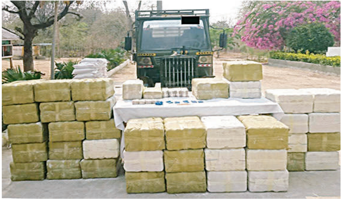
၂၀၂၆ ခုနှစ် ဧပြီ ၄ ရက်တွင် နတ်မောက်မြို့နယ် စိုင်ကောင်းကျေးရွာအနီး၌ တရားခံ သုံးဦးနှင့်အတူ စိတ်ကြွရူးသွပ်ဆေးပြား ၇၈ သိန်း၊ ကာလတန်ဖိုးငွေကျပ် ၁၁ ဒသမ ၇ ဘီလီယံခန့် ဖမ်းဆီးရမိမှုမှတ်တမ်းဓာတ်ပုံ။

နေပြည်တော် ဧပြီ ၅ ဆောင်ရောင်းဝယ်မှုများ ထိရောက်စွာ သယ်ဆောင်လေ့ရှိသည့် လမ်းကြောင်း နိုင်ငံတော်အစိုးရအနေဖြင့် အနာဂတ် တားဆီးကာကွယ် တိုက်ဖျက်ရေးကို များ၌ စစ်ဆေးရှာဖွေဖော်ထုတ်ဖမ်းဆီးမှု မျိုးဆက်သစ်လူငယ်များ အပါအဝင် အမျိုးသားရေးတာဝန် တစ်ရပ်အဖြစ် များ တိုးမြှင့်လုပ်ဆောင်နေသကဲ့သို့ လူသားမျိုးနွယ်စုတစ်ခုလုံးကို အန္တရာယ် သတ်မှတ်၍ အရှိန်အဟုန်မြှင့်ဆောင်ရွက် အိမ်နီးချင်းနိုင်ငံများနှင့်ပူးပေါင်း၍ ဖြစ်စေသည့် မူးယစ်ဆေးဝါးသယ် လျက်ရှိသည်။ ထို့ပြင် မူးယစ်ဆေးဝါး စာမျက်နှာ ၂၃ ကော်လံ ၁ ☆