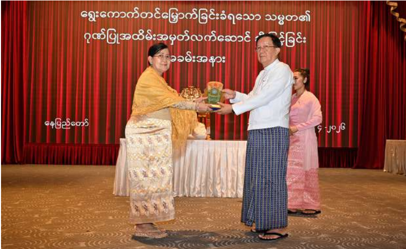
နိုင်ငံတော်လုံခြုံရေးနှင့် အေးချမ်းသာယာရေးကော်မရှင်အဖွဲ့ဝင် ဦးအောင်လင်းဒွေး သာသနာရေးနှင့် ယဉ်ကျေးမှုဝန်ကြီးဌာန ဒုတိယဝန်ကြီး ဒေါ်နုမြစ်အား ရွေးကောက်တင်မြောက်ခြင်းခံရသော သမ္မတ၏ ဂုဏ်ပြုအထိမ်းအမှတ်လက်ဆောင်ပေးအပ်ချီးမြှင့်စဉ်။

ဆက်လက်၍ ကော်မရှင်အဖွဲ့ဝင် နိုင်ငံတော်ဝန်ကြီးချုပ် ဦးညိုစော၊ ကော်မရှင်အဖွဲ့ဝင် ဦးအောင်လင်းဒွေး၊ ကော်မရှင်အတွင်းရေးမှူး တပ်မတော်ကာကွယ်ရေးဦးစီးချုပ် ဗိုလ်ချုပ်ကြီးရဲဝင်းဦးတို့က ပြည်ထောင်စုအဆင့်ပုဂ္ဂိုလ်များ၊ ဒုတိယဝန်ကြီးများနှင့် အဆင့်တူပုဂ္ဂိုလ်များကို ရွေးကောက်တင်မြောက်ခြင်းခံရသော သမ္မတ၏ ဂုဏ်ပြုအထိမ်းအမှတ်လက်ဆောင်များကို ပေးအပ်ချီးမြှင့်သည်။