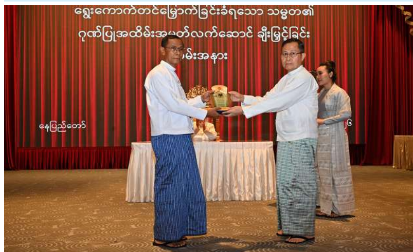
နေပြည်တော်

ရွေးကောက်တင်မြှောက်ခြင်းခံရသောသမ္မတ နိုင်ငံတော်လုံခြုံရေးနှင့် အေးချမ်းသာယာ ရေးကော်မရှင်ဥက္ကဋ္ဌ ဗိုလ်ချုပ်မှူးကြီးမင်းအောင်လှိုင် ပြည်ထောင်စုရွေးကောက်ပွဲကော်မရှင် ဥက္ကဋ္ဌ ဦးသန်းစိုးအား ဂုဏ်ပြုအထိမ်းအမှတ်လက်ဆောင်ပေးအပ်ချီးမြှင့်စဉ်။