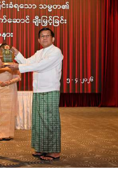
ရွေးကောက်တင်မြောက်ခြင်းခံရသော သမ္မတ၏ ရွေးကော်မရှင်ဥက္ကဋ္ဌ ဗိုလ်ချုပ်မှူးကြီးမင်းအောင်လှိုင် ပို့ဆောင်ရေးနှင့် ဆက်သွယ်ရေးဝန်ကြီးဌာန ပြည်ထောင်စုဝန်ကြီး ဦးမြထွန်းဦးအား ဂုဏ်ပြုအထိမ်းအမှတ်လက်ဆောင်ပေးအပ်ချီးမြှင့်စဉ်။

အခက်အခဲမျိုးစုံကြားမှ နိုင်ငံတော်ပြန်လည်တည်ဆောက်ရေးလုပ်ငန်းစဉ်များတွင် သစ္စာရှိရှိ ရိုးရိုးသားသား၊ တက်တက်ကြွကြွဖြင့် ကိုယ်စွမ်းဉာဏ်စွမ်းရှိသမျှ ကြိုးစားဆောင်ရွက်ခဲ့ကြသည်ကို အသိအမှတ်ပြုကြောင်း၊ မိမိ၏ဦးဆောင်မှုအောက်တွင် ယုံယုံကြည်ကြည်၊ ရဲရဲဝံ့ဝံ့၊ စွန့်လွှတ်စွန့်စားလုပ်ဆောင်ခဲ့ကြသည်များကို မှတ်တမ်းတင်ဂုဏ်ပြုကြောင်း၊ တာဝန်ထမ်းဆောင်စဉ်ကာလတွင် ကိုယ်ကျိုးမဖက်၊ အတ္တကင်းကင်းဖြင့် နိုင်ငံနှင့်ပြည်သူအကျိုးကို အမျိုးသားရေးစိတ်ဓာတ်အပြည့်ဖြင့် စည်းလုံးညီညွတ်စွာ ပူးပေါင်းဆောင်ရွက်မှုများကို ကျေးဇူးတင်ကြောင်း၊ မိမိတို့တစ်တွေ့သည် မြန်မာနိုင်ငံ၏သမိုင်းတွင် နိုင်ငံ၏အန္တရာယ်ရန်စွယ်ကျမည့် အချိုးအကွေ့တစ်ခုကို ပြည်ထောင်စုစိတ်ဓာတ်ဖြင့် ကာကွယ်စောင့်ရှောက်နိုင်ခဲ့ပြီး နိုင်ငံကို မူလရည်မှန်းသည့် ဒီမိုကရေစီ