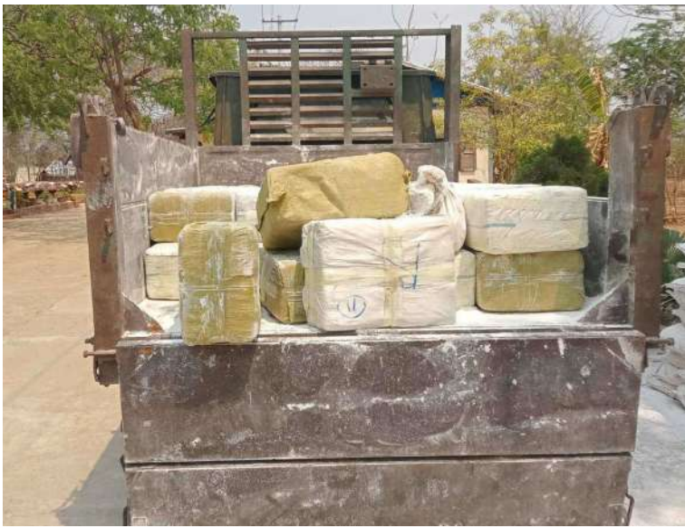
မူးယစ်ဆေးဝါးများတင်ဆောင်လာသည့် MDY/ 9V-54836 ထော်လာဂျီ စိမ်းပုပ်ရောင်(လိုင်စင်မဲ့)ယာဉ် မှတ်တမ်းဓာတ်ပုံ။