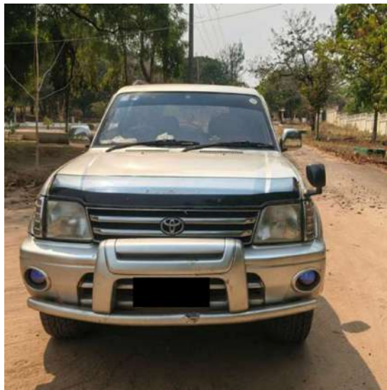
ဖမ်းဆီးရမိ ယာဉ်အမှတ် MDY-20/1F-2504 TOYOTA PRADO ခဲရောင် (လိုင်စင်မဲ့)ယာဉ် မှတ်တမ်းဓာတ်ပုံ။