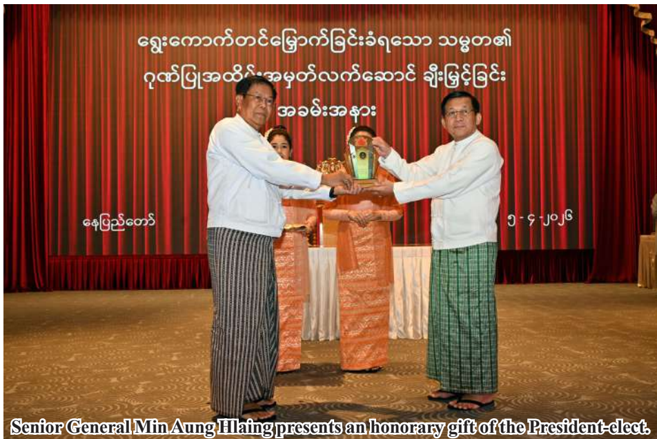
Senior General Min Aung Hlaing presents an honorary gift of the President-elect.

Also, he stated that he had previously mentioned the importance of leadership in every area. He noted with regret that during the five-year term of their responsibility, some high-ranking officials and those in leadership positions experienced failures in their duties toward the country and the people, See Page 13