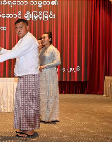
ရွေးကောက်တင်မြောက်ခြင်းခံရသော သမ္မတ၏ ရွေးကော်မရှင်ဥက္ကဋ္ဌ ဗိုလ်ချုပ်မှူးကြီးမင်းအောင်လှိုင်က ကော်မရှင်အဖွဲ့ဝင် ဦးကျော်ဝင်းသိန်းအား ရွေးကောက်တင်မြောက်ခြင်းခံရသော သမ္မတ၏ ဂုဏ်ပြုအထိမ်းအမှတ်လက်ဆောင်ပေးအပ်ချီးမြှင့်စဉ်။

နိုင်ငံတော်လုံခြုံရေးနှင့် အေးချမ်းသာယာရေးကော်မရှင်ဥက္ကဋ္ဌ ဗိုလ်ချုပ်မှူးကြီးမင်းအောင်လှိုင်က ကော်မရှင်ဒုတိယဥက္ကဋ္ဌ ဒုတိယဗိုလ်ချုပ်မှူးကြီးစိုးဝင်း၊ ကော်မရှင်အဖွဲ့ဝင် နိုင်ငံတော်ဝန်ကြီးချုပ် ဦးညိုစော၊ ကော်မရှင်အဖွဲ့ဝင် ဦးအောင်လင်းဒွေး၊ ကော်မရှင်အတွင်းရေးမှူး တပ်မတော်