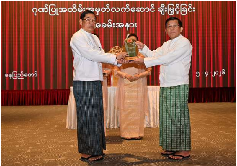
နေပြည်တော်

ရွေးကောက် တင်မြှောက်ခြင်း ခံရသောသမ္မတ နိုင်ငံတော်လုံခြုံရေးနှင့် အေးချမ်းသာယာရေး ကော်မရှင်ဥက္ကဋ္ဌ ဗိုလ်ချုပ်မှူးကြီး မင်းအောင်လှိုင် နိုင်ငံတော်လုံခြုံရေးနှင့် အေးချမ်းသာယာရေး ကော်မရှင် ဒုတိယဥက္ကဋ္ဌ ဒုတိယဗိုလ်ချုပ်မှူးကြီး စိုးဝင်း အား ဂုဏ်ပြုအထိမ်းအမှတ် လက်ဆောင် ပေးအပ်ချီးမြှင့်စဉ်။