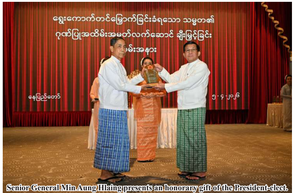
Senior General Min Aung Hlaing presents an honorary gift of the President-elect.

State Security and Peace Commission Senior General Min Aung Hlaing, who gave away the gifts.