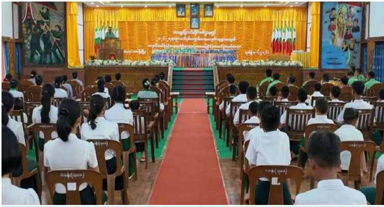
အရှေ့မြောက်တိုင်းစစ်ဌာနချုပ် တိုင်းမှူး ဗိုလ်ချုပ်အေးမင်းဦး ကျောင်းသား၊ ကျောင်းသူများအတွက် ကျောင်းဝတ်စုံ၊ စာရေးကိရိယာနှင့် ထီးများ ပေးအပ်ပွဲတွင် အမှာစကားပြောကြားစဉ်။

ဦးစွာ တိုင်းမှူးက အမှာစကား ပြောကြားသည်။ ထို့နောက် တိုင်းမှူးနှင့် တာဝန်ရှိသူများက တိုင်းစစ်ဌာနချုပ်နှင့် ကွပ်ကဲမှုအောက် တပ်ရင်း၊ တပ်ဖွဲ့များမှ တပ်မတော်သားမိသားစုဝင်ကျောင်းသား၊ ကျောင်းသူများအတွက် ကျောင်းဝတ်စုံ၊ စာရေးကိရိယာနှင့် ထီးများ ပေးအပ်ချီးမြှင့် ပြီး တိုင်းမှူးက တက်ရောက်လာကြသည့် ဆရာ၊ ဆရာမများနှင့် ကျောင်းသား၊ ကျောင်းသူများကို ရင်းရင်းနှီးနှီး လိုက်လံနှုတ်ဆက်ခဲ့ကြောင်း သတင်း ရရှိသည်။