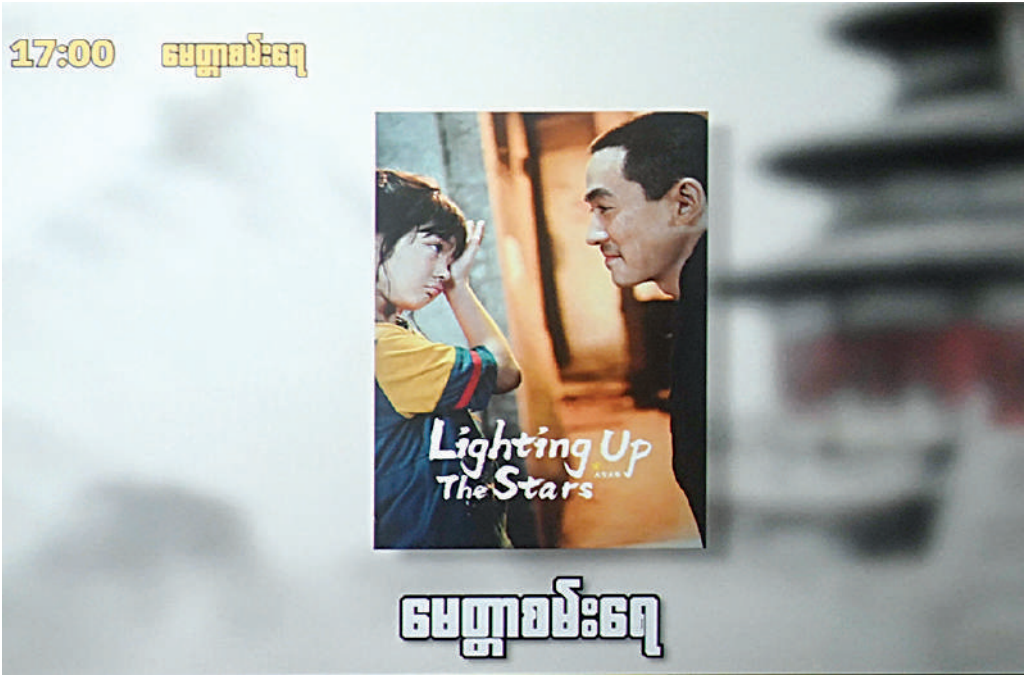
ပြည်ထောင်စုသမ္မတမြန်မာနိုင်ငံတော် နိုင်ငံတော်သမ္မတ ဦးစမ်းအောင်လှိုင်နှင့် ဇနီး ဒေါ်ကြူကြူလှ တရုတ်-မြန်မာနှစ်နိုင်ငံအကြား သံတမန်ဆက်ဆံရေးထူထောင်ခြင်း ၇၆ နှစ်မြောက်အထိမ်းအမှတ် “၂၀၂၆ ခုနှစ် တရုတ် ရုပ်ရှင်ပြပွဲရက်သတ္တပတ်အစီအစဉ်” ဆိုင်ရာ ဗီဒီယိုနှင့် မေတ္တာစမ်းရေ(Lighting Up the Stars) ရုပ်ရှင်ကို ကြည့်ရှုစဉ်။