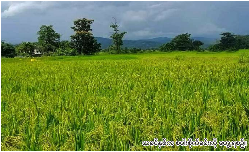
ယခင်နှစ်က စပါးစိုက်ခင်းကို တွေ့ရစဉ်။

တန့်ဆည် ဇွန် ၈ စစ်ကိုင်းတိုင်းဒေသကြီး ရေဦးခရိုင် တန့်ဆည်မြို့နယ်တွင် ယခုနှစ် မိုးသီးနှံစိုက်ပျိုးရာသီ၌ စပါး ၉၃၃၅၂ ဧက စိုက်ပျိုးမည်ဖြစ်ကြောင်း တန့်ဆည်မြို့နယ် စိုက်ပျိုးရေးဦးစီးဌာနမှ သိရသည်။