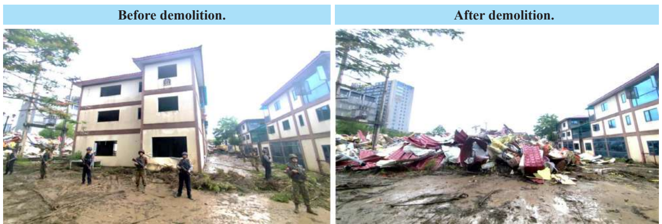
A building destroyed by machinery that were used to operate illegal online gambling businesses in the Shwe Kokko area, Myawady District, Kayin State