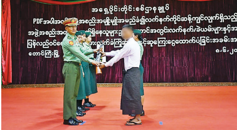
အရှေ့ပိုင်းတိုင်းစစ်ဌာနချုပ် တိုင်းမှူး ဗိုလ်မှူးချုပ်ကျော်နိုင်ဦးထံ ဥပဒေဘောင်အတွင်း ဝင်ရောက်လာသူ တစ်ဦးက လက်နက်အပ်နှံစဉ်။

နေပြည်တော် ၉ ဇွန် ၈ တပ်မတော်အနေဖြင့် နိုင်ငံ တော် တည်ငြိမ်အေးချမ်းရေးကို အစဉ်တစိုက်အလေးထားဆောင် ရွက်လျက်ရှိသည်နှင့်အညီ အကြမ်း ဖက်ချေမှုန်းမှုစစ်ဆင်ရေး (Counter - Terrorism Operation) များ တွင် အောင်မြင်မှုများရရှိကာ အကြမ်းဖက်သောင်းကျန်းသူများ ယာယီထိန်းချုပ်ထားသည့် နယ် မြေများကို အပြီးတိုင်ပြန်လည် ထိန်းချုပ်နိုင်ခဲ့ပြီး ဆက်သွယ်ရေး လမ်းကြောင်းများ အပြည့်အဝ ပြန်လည်ဖွင့်လှစ်ပေးနိုင်ခဲ့မှုအပေါ် စာမျက်နှာ ၂၅ ကော်လံ ၁ ❖