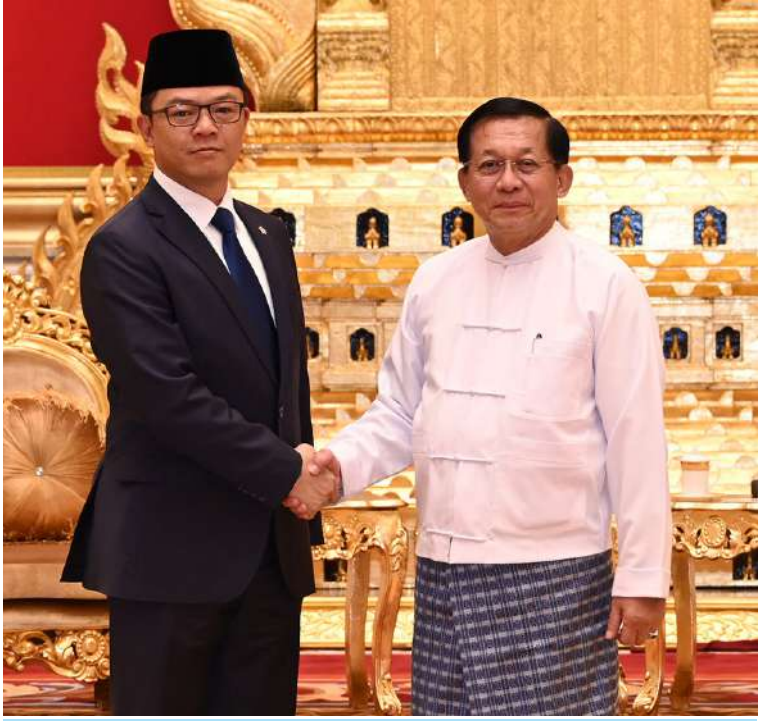
ပြည်ထောင်စုသမ္မတမြန်မာနိုင်ငံတော် နိုင်ငံတော်သမ္မတ ဦးမင်းအောင်လှိုင် အင်ဒိုနီးရှားနိုင်ငံခြားရေးဝန်ကြီး H.E. Mr. Sugiono အား ရင်းရင်းနှီးနှီးနှုတ်ဆက်စဉ်။ ပတ်သက်၍ ရင်းနှီးပွင့်လင်းစွာ အမြင်ချင်း ဖလှယ်ဆွေးနွေးခဲ့ကြသည်။ တွေ့ဆုံပွဲအပြီးတွင် နိုင်ငံတော်သမ္မတ နှင့် အင်ဒိုနီးရှားနိုင်ငံခြားရေးဝန်ကြီးတို့ သည် မှတ်တမ်းတင်ဓာတ်ပုံရိုက်ခဲ့ကြ ကြောင်း သတင်းရရှိသည်။ (၅၀၁)

စနစ်သည် ကမ္ဘာပေါ်တွင် အကောင်းဆုံး နိုင်ငံရေးစနစ်ဖြစ်သော်လည်း ဒီမိုကရေစီ စနစ်ကို အကောင်အထည်ဖော်ဆောင်ရွက် ရာ၌ မိမိတို့နိုင်ငံများရှိ ကိုယ်ပိုင်စရိုက် လက္ခဏာများ၊ ယုံကြည်မှု ကိုးကွယ်ရာနှင့် ယဉ်ကျေးမှုတန်ဖိုးများအပေါ် အခြေခံ၍ မိမိတို့နိုင်ငံနှင့်ကိုက်ညီသည့် ဒီမိုကရေစီ စနစ်ကို မိမိကိုယ်ပိုင်ဟန်ဖြင့် ကျင့်သုံး ဆောင်ရွက်သင့်သည့် အခြေအနေများ၊ ဒီမိုကရေစီစနစ်နှင့်အညီ နိုင်ငံ၏အနာဂတ် ကောင်းကျိုးများကို ဆောင်ရွက်ပေးနိုင် မည့် အာမခံချက်ရှိသည့် အစိုးရတစ်ရပ် အဖြစ် ဆောင်ရွက်သွားမည့်အခြေအနေ များ၊ မြန်မာနိုင်ငံအစိုးရအနေဖြင့် ပြည်သူ များကအားကိုးရပြီး ဖွံ့ဖြိုးတိုးတက်သော နိုင်ငံ၊ တည်ငြိမ်အေးချမ်းသော နိုင်ငံတစ်ခု အဖြစ်ဖော်ဆောင်ပေးနိုင်သည့် မှတ် ကျောက်တင်ခံနိုင်သော အစိုးရတစ်ရပ် အဖြစ် ဆက်လက်ကြိုးပမ်းဆောင်ရွက် သွားမည့်အခြေအနေများ၊ မြန်မာနိုင်ငံနှင့် အင်ဒိုနီးရှားနိုင်ငံတို့အကြား သံတမန် ဆက်ဆံမှု၊ ချစ်ကြည်ရင်းနှီးမှုနှင့် ပူးပေါင်း ဆောင်ရွက်မှုများ တိုးမြှင့်ဆောင်ရွက် သွားနိုင်မည့် အခြေအနေများနှင့်