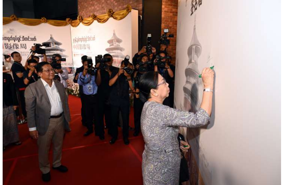
Daw Kyu Kyu Hla puts on her signature in commemoration of launching the 2026 China Film Week.

Nay Pyi Taw June 8 To mark the 76 th Anniversary of the establishment of the diplomatic relations between China and Myanmar, the "2026 China Film Week" was opened at J Cineplex of Ottarathiri Department Store in Nay Pyi Taw yesterday afternoon, attended by President of the Republic of the Union of Myanmar U Min Aung Hlaing and wife Daw Kyu Kyu Hla. Also present at the ceremony were Vice President Daw Nan Ni Ni Aye, Pyithu Hluttaw Speaker U Khin Yi