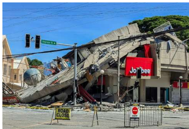
This photo taken on June 8, 2026 shows a damaged building after a 7.8 magnitude earthquake, in General Santos City, the Philippines.