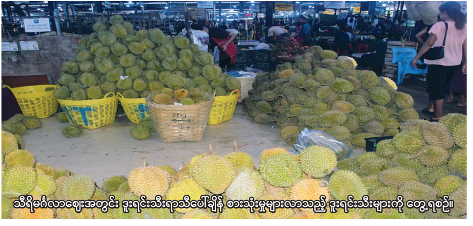
သီရိမင်္ဂလာဈေးအတွင်း ခူးရင်းသီးရာသီဖော်ချိန် စားသုံးမှုများလာသည့် ခူးရင်းသီးများကို တွေ့ရစဉ်။

ရန်ကုန် ဇွန် ၈ ၊ ရန်ကုန်မြို့ လှိုင်မြို့နယ်ရှိ သီရိမင်္ဂလာဈေးတွင် ခူးရင်းသီးများ လက်လီလက်ကားရောင်းချလျက်ရှိရာ ခူးရင်းသီးများသည်အတွက် ခူးရင်းသီးများ အရောင်းသွက်နေကြောင်း အဆိုပါဈေးမှ သိရသည်။ မြန်မာနိုင်ငံတွင် ခူးရင်းသီးကို မွန်ပြည်နယ်၊ ကရင်ပြည်နယ်၊ တနင်္သာရီတိုင်းဒေသကြီးတို့မှ အဓိကစိုက်ပျိုးထွက်ရှိပြီး စားသုံးသူဈေးကွက်တွင် မြန်မာ့ခူးရင်းအပြင် ထိုင်းခူးရင်းသီးများကိုလည်း ဝယ်ယူစားသုံးကြသည်။ “စားသုံးသူများအတွက် ဒီနှစ်လဲ ရောင်း အားကောင်းတယ်။ မြန်မာမျိုး၊ ထိုင်းမျိုးရှိပေမယ့် စားသုံးသူက သူ့အကြိုက်နဲ့သူမို့ အကုန်ရောင်းရပါ တယ်။ နယ်တွေက အမှာတွေကို အများဆုံးတင်ပို့ ရောင်းချနေရပါတယ်”ဟု စာမျက်နှာ ၂၄ ကော်လံ ၄ O