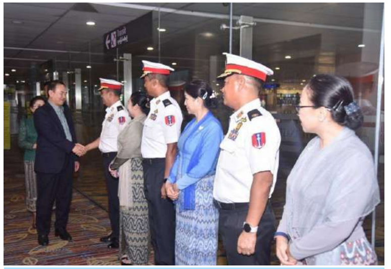
လာအိုပြည်သူ့တပ်မတော်၏ စစ်ဦးစီးဌာန ဒုတိယအကြီးအကဲဖြစ်သူ Major General Vanthong BOUTTAVONG ဦးဆောင်သော ချစ်ကြည်ရေးကိုယ်စားလှယ်အဖွဲ့ကို တပ်မတော်(ရေး)မှ အရာရှိကြီးများ၊ မြန်မာနိုင်ငံဆိုင်ရာ လာအိုစစ်သံမှူးနှင့် တာဝန်ရှိသူများက ရန်ကုန်အပြည်ပြည်ဆိုင်ရာလေဆိပ်၌ ကြိုဆိုနှုတ်ဆက်စဉ်။

နေပြည်တော် ဇွန် ၈ ပြည်ထောင်စုသမ္မတမြန်မာနိုင်ငံတော် သို့ ချစ်ကြည်ရေးခရီးလည်ပတ်ရန်အတွက် လာအိုပြည်သူ့တပ်မတော်၏ စစ်ဦးစီး ဌာန ဒုတိယအကြီးအကဲဖြစ်သူ Major General Vanthong BOUTTAVONG ဦးဆောင်သော ချစ်ကြည်ရေးကိုယ်စား လှယ်အဖွဲ့သည် ယနေ့ညနေပိုင်းတွင် ရန်ကုန်မြို့သို့ လေကြောင်းခရီးဖြင့် ရောက်ရှိလာရာ တပ်မတော်(ရေး) မှ အရာရှိကြီးများ၊ မြန်မာနိုင်ငံဆိုင်ရာ လာအို စစ်သံမှူးနှင့် တာဝန်ရှိသူများက ရန်ကုန်အပြည်ပြည်ဆိုင်ရာ လေဆိပ်၌ ကြိုဆိုနှုတ်ဆက်ခဲ့ကြသည်။ အဆိုပါ ချစ်ကြည်ရေးကိုယ်စားလှယ် အဖွဲ့သည် ဇွန် ၁၂ ရက်ထိ ငါးရက်ကြာ နေထိုင်၍ မြန်မာနိုင်ငံရှိ အထင်ကရ နေရာများသို့ လေ့လာလည်ပတ်ခြင်းနှင့် နှစ်နိုင်ငံရေတပ်ဆိုင်ရာ ချစ်ကြည်ရေး ခရီးစဉ်များ ဆက်လက်ဆောင်ရွက် သွားမည်ဖြစ်ကြောင်း သတင်း ရရှိသည်။ (၅၀၁)