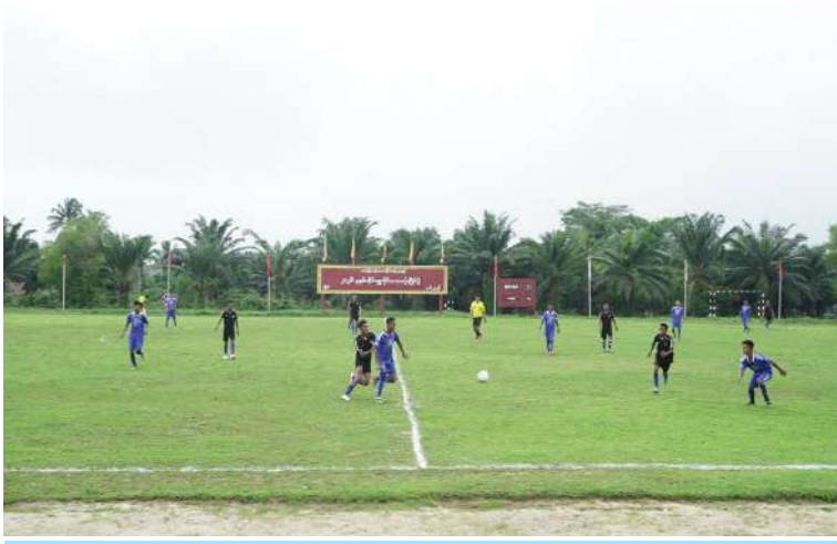
ကမ်းရိုးတန်းဒေသတိုင်းစစ်ဌာနချုပ်၏ ၂၀၂၆ ခုနှစ် တိုင်းမှူးဒိုင်း ဘောလုံးပြိုင်ပွဲ အဖွင့်ပွဲစဉ် ယှဉ်ပြိုင်ကစားနေမှုကို တွေ့ရစဉ်။

ဟန်နှင့် အဖွဲ့ဝင်များ၊ အဆင့်မြှင့်တင်ရာ တာဝန်ရှိသူများ၊ အရာရှိ၊ စစ်သည်၊ မိသားစုများ၊ ဒိုင်အဖွဲ့ဝင်များ၊ ပြိုင်ပွဲဝင် အားကစားသမားများနှင့် အားကစား ဝါသနာရှင်များ တက်ရောက် ကြသည်။ ဦးစွာ တိုင်းမှူးက အဖွင့်အမှာစကား ပြောကြားသည်။ ထို့နောက် တိုင်းမှူးနှင့် တက်ရောက်လာကြသူများက အဖွင့်ပွဲစဉ် ယှဉ်ပြိုင်ကစားနေမှုများကို ကြည့်ရှု အားပေးကြသည်။ အဆိုပါ တိုင်းမှူးဒိုင်းဘောလုံးပြိုင်ပွဲ ကို တိုင်းစစ်ဌာနချုပ်ကွပ်ကဲမှုအောက် တပ်နယ် တပ်ရင်း၊ တပ်ဖွဲ့များမှ ပြိုင်ပွဲဝင် အသင်း ရှစ်သင်းဖြင့် ဇွန် ၂၅ ရက်ထိ ယှဉ်ပြိုင်ကစားသွားမည် ဖြစ်ကြောင်း သတင်းရရှိသည်။ (၅၀၁)