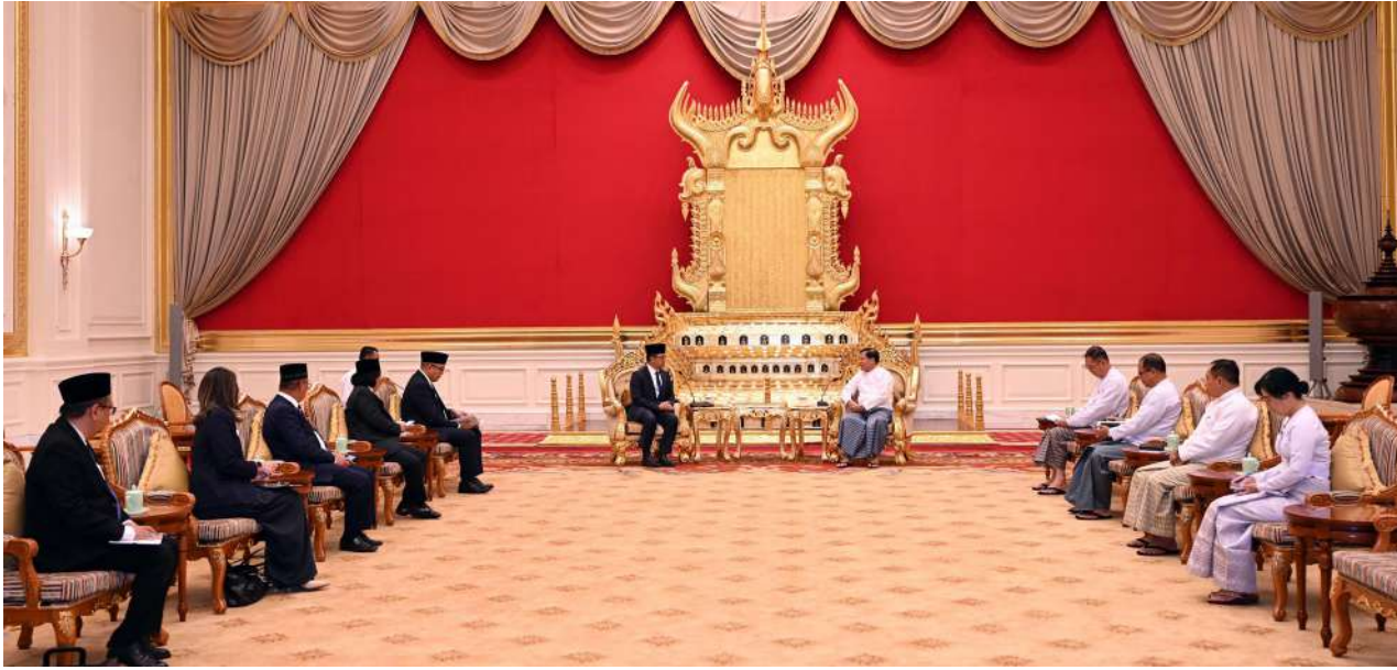
President U Min Aung Hlaing receives the delegation led by Minister of Foreign Affairs of Indonesia H.E. Mr. Sugiono.