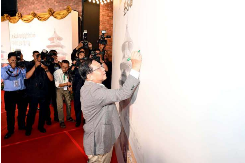
President U Min Aung Hlaing puts on his signature in commemoration of launching the 2026 China Film Week.