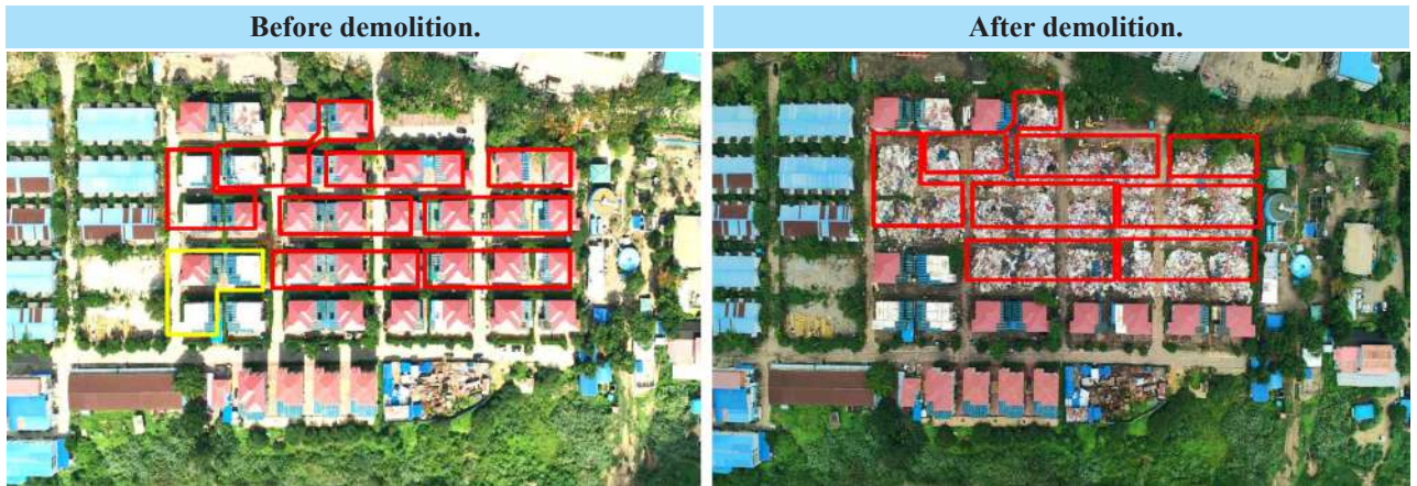
Demolition of illegal buildings used to operate illegal online gambling businesses in the Shwe Kokko area, Myawady District, Kayin State.

Nay Pyi Taw June 8 Joint departmental task forces have been carrying out the complete demolition of illegal buildings and the systematic destruction of equipment used in operations in areas of Shwe Kokko and KK Park in Myawady Township, Kayin State, where online fraud and gambling operations had been based. Today, it is reported that three illegal three-story residential buildings in the Shwe Kokko area were further demolished in a systematic manner. It is learned that among the 77 buildings in the Shwe Kokko area that were used to commit online fraud and gambling, they have been categorized by building type—57 buildings to be demolished using vehicles and machinery, and 20 buildings to be destroyed by blasting—and are being systematically demolished. Today, of the 57 buildings designated for demolition by vehicles and machinery, three three-story residential buildings were further demolished systematically using vehicles and machinery. To date, a total of 45 buildings have been systematically demolished, and the remaining 32 illegal buildings will continue to be systematically destroyed. The Government is actively undertaking online fraud and gambling suppression measures as a national duty, coordinating and collaborating not only with domestic forces but also with neighboring countries to ensure that such operations cannot establish a foothold in Myanmar at all.