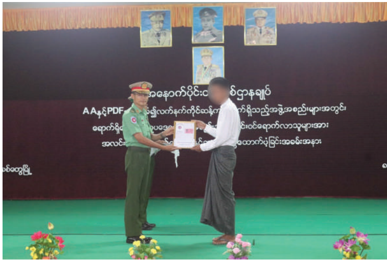
အနောက်ပိုင်းတိုင်းစစ်ဌာနချုပ် တိုင်းမှူး ဗိုလ်မှူးချုပ်ကျော်ဇော ဥပဒေဘောင် အတွင်း ဝင်ရောက်လာသူတစ်ဦးကို ဆုကြေးငွေနှင့် ထောက်ပံ့ပစ္စည်းများ ပေးအပ်စဉ်။

နေပြည်တော် ၉ ဇွန် ၈ နိုင်ငံတော်အစိုးရသည် PDF အပါအဝင် အဖွဲ့အစည်းအမျိုးမျိုးအမည်ခံ၍ လက်နက်ကိုင် ဆန့်ကျင်လျက်ရှိသည့် အဖွဲ့အစည်းများအတွင်း ရောက်ရှိနေသူများကို ဥပဒေဘောင်အတွင်းသို့ ပြန်လည်ဝင်ရောက်ရန်ဖိတ်ခေါ်၍ ဥပဒေဘောင်အတွင်းသို့ ပြန်လည်ဝင်ရောက်လာကြသူများကိုလည်း လိုအပ်သည့် ကူညီပံ့ပိုးမှုများ ဆောင်ရွက်ပေးလျက်ရှိရာ နိုင်ငံတော်နှင့် တပ်မတော်၏ ငြိမ်းချမ်းရေးလုပ်ငန်းစဉ်များကို နားလည်သဘောပေါက်လာသည့် AA အဖွဲ့ဝင် အမျိုးသား ငါးဦးနှင့် PDF အမည်ခံ ကျောင်းသား လက်ရုံးတပ်(SAF) မှ အမျိုးသား တစ်ဦးတို့သည် ဥပဒေဘောင်အတွင်းသို့ ထပ်မံဝင်ရောက်လာကြသည်။