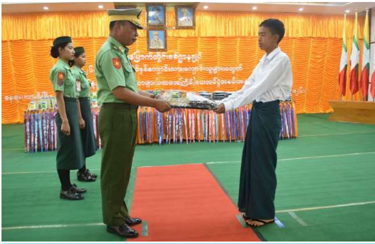
အရှေ့မြောက်တိုင်းစစ်ဌာနချုပ် တိုင်းမှူး ဗိုလ်ချုပ်အေးမင်းဦး ကျောင်းသား တစ်ဦးကို စာရေးကိရိယာများ ပေးအပ်စဉ်။

နေပြည်တော် ဇွန် ၈ ၂၀၂၆ - ၂၀၂၇ ပညာသင်နှစ်တွင် တက်ရောက်ပညာသင်ကြားလျက်ရှိသည့် အရှေ့မြောက်တိုင်းစစ်ဌာနချုပ်နှင့်ကွပ်ကဲ မှုအောက် တပ်ရင်း၊ တပ်ဖွဲ့များမှ တပ်မတော်သားမိသားစုဝင်ကျောင်းသား၊ ကျောင်းသူများအတွက် ကျောင်းဝတ်စုံ၊ စာရေးကိရိယာနှင့် ထီးများ ပေးအပ်ပွဲကို ယနေ့ နံနက်ပိုင်းတွင် တိုင်းစစ်ဌာနချုပ်ရှိ ခန်းမ၌ ပြုလုပ်ရာ တိုင်းမှူး ဗိုလ်ချုပ် အေးမင်းဦးနှင့် တာဝန်ရှိသူများ၊ အရာရှိ၊ စစ်သည်၊ မိသားစုဝင်များ၊ ဆရာ၊ ဆရာမ များနှင့် ကျောင်းသား၊ ကျောင်းသူများ တက်ရောက်ကြသည်။