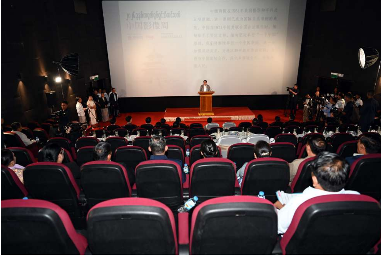
President U Min Aung Hlaing addresses the opening of 2026 China Film Week to mark the 76 th Anniversary of the establishment of the diplomatic relations between China and Myanmar.