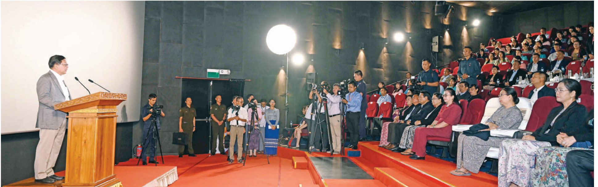
ပြည်ထောင်စုသမ္မတမြန်မာနိုင်ငံတော် နိုင်ငံတော်သမ္မတ ဦးမင်းအောင်လှိုင် တရုတ်-မြန်မာနှစ်နိုင်ငံအကြား သံတမန်ဆက်ဆံရေးထူထောင်ခြင်း ဂုဏ် နှစ်မြောက်အထိမ်းအမှတ် “၂၀၂၆ ခုနှစ် တရုတ်ရုပ်ရှင်ပြပွဲ ရက်သတ္တပတ်အစီအစဉ်” ဖွင့်ပွဲအခမ်းအနားတွင် အမှာစကားပြောကြားစဉ်။